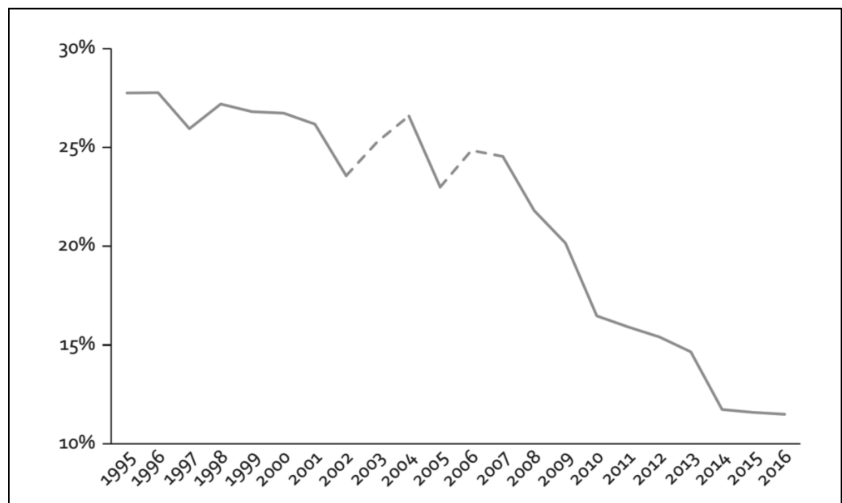
Διάγραμμα 1: Οι επενδύσεις στις κατασκευές ως μερίδιο των Ακαθάριστων Σχηματισμών Παγίου Κεφαλαίου συν τις συνολικές Δαπάνες για Εργασία

Η διατριβή εκκίνησε θέτοντας το λεπτομερές εννοιολογικό πλαίσιο, παρουσιάζοντας σχηματικά μια θεωρητικοποίηση του δικτύου των δυναμικών συσχετίσεων μεταξύ εξευγενισμού και εργασιακής ευελικτοποίησης/επιφα-