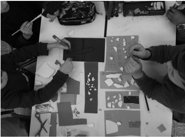
Εικόνα 1: Ο χάρτης της γειτονιάς των Εξαρχείων περιλαμβάνει αεροδρόμιο. Βιωματικό εργαστήρι «Χαρτογράφηση της γειτονιάς μου». Ιανουάριος 2019 - Φεβρουάριος 2020.