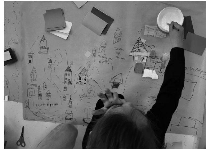
Εικόνα 4: Χάρτες που αποτυπώνουν χωροχρονικές εξιστορήσεις της καθημερινότητας των παιδιών. Βιωματικό εργαστήριο «Χαρτογράφηση της γειτονιάς μου». Ιανουάριος 2019 - Φεβρουάριος 2020.

φησης ενισχύει επίσης την πρακτική της κριτικής παιδαγωγικής σκέψης, ενδυναμώνοντας την πολιτική και κοινωνική συνείδηση των παιδιών. Μέσα από την παρατήρηση και καταγραφή του περιβάλλοντός τους, τα παιδιά αποκτούν μια βαθύτερη εμπλοκή με αυτό, επιτυγχάνοντας μια ουσιαστική κατανόηση της κοινωνικής πραγματικότητας. Η εμπλοκή τους καθίσταται κρίσιμη και αναγκαία για την εκπλήρωση της ιδιότητάς τους ως κοινωνικά όντα και σε αυτή την περίπτωση ο χάρτης μετατρέπεται από μια αναπαράσταση σε έναν ενεργό παράγοντα κατασκευής γνώσης, χειραφέτησης και δύναμης και γιατί όχι και σε ένα μέσο προώθησης της κοινωνικής αλλαγής.