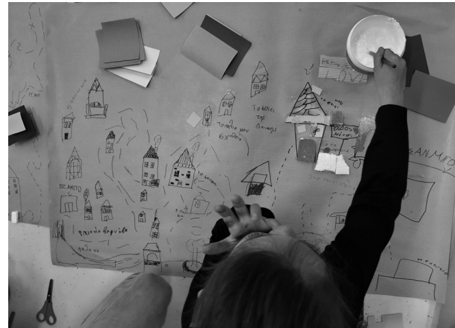
Εικόνα 4: Χάρτες που αποτυπώνουν χωροχρονικές εξιστορήσεις της καθημερινότητας των παιδιών. Βιωματικό εργαστήριο «Χαρτογράφηση της γειτονιάς μου». Ιανουάριος 2019 - Φεβρουάριος 2020.

φησης ενισχύει επίσης την πρακτική της κριτικής παιδαγωγικής σκέψης, ενδυναμώνοντας την πολιτική και κοινωνική συνείδηση των παιδιών. Μέσα από την παρατήρηση και καταγραφή του περιβάλλοντός τους, τα παιδιά αποκτούν μια βαθύτερη εμπλοκή με αυτό, επιτυγχάνοντας μια ουσιαστική κατανόηση της κοινωνικής πραγματικότητας. Η εμπλοκή τους καθίσταται κρίσιμη και αναγκαία για την εκπλήρωση της ιδιότητάς τους ως κοινωνικά όντα και σε αυτή την περίπτωση ο χάρτης μετατρέπεται από μια αναπαράσταση σε έναν ενεργό παράγοντα κατασκευής γνώσης, χειραφέτησης και δύναμης και γιατί όχι και σε ένα μέσο προώθησης της κοινωνικής αλλαγής.