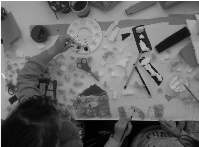
Εικόνα 3: Ο χάρτης αναπαριστά τη γειτονιά των Εξαρχείων χιονισμένη. Βιωματικό εργαστήριο «Χαρτογράφηση της γειτονιάς μου». Ιανουάριος 2019 - Φεβρουάριος 2020.