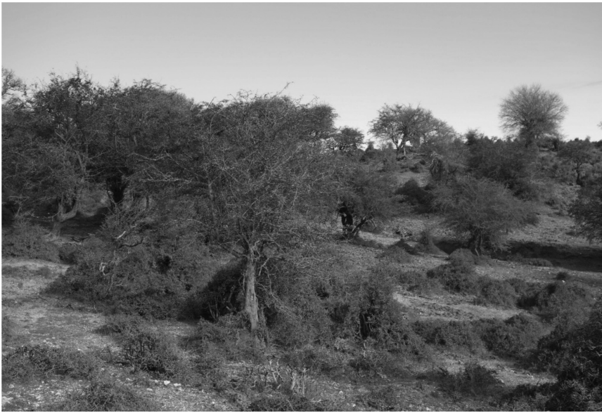
Εικόνα 2: Δεκάδες άγρια καρποφόρα δέντρα της χώρας, όπως ο κράταιγος της φωτογραφίας, μπορούν να αξιοποιηθούν σε παραγωγικές αναδασώσεις, ιδιαίτερα αφού σήμερα πλέον πολλά άγρια φρούτα και καρποί του δάσους αξιοποιούνται σε καινοτόμα προϊόντα της βιομηχανίας τροφίμων και φαρμάκων ως υπερ-τροφές, συμπληρώματα διατροφής ή και ελιξίρια μακροζωίας.

παρουσιάζεται η πιλοτική συλλογή, ταυτοποίηση, αξιολόγηση και αξιοποίηση τοπικών παραδοσιακών ποικιλιών οπωροφόρων δέντρων (π.χ. μηλιάς, αχλαδιάς, κερασιάς, κυδωνιάς και ροδιάς) στην ορεινή Ελλάδα. Τα αυτόχθονα αυτά καρποφόρα είδη είναι εξελικτικά προσαρμοσμένα στο περιβάλλον της κάθε περιοχής (με πάνω από 200 επιλεγμένες ποικιλίες να ταυτοποιούνται ήδη γενετικά), διαθέτουν φυσική ανθεκτικότητα σε εχθρούς και ασθένειες και παράγουν καρπούς με υψηλή διατροφική αξία. Επιπλέον άγρια καρποφόρα είδη, όπως τα κυνόροδα, το ρούδι ή σουμάκι, τα σμέουρα, τα κρίνα κ.ά., έχουν συχνά και ευεργετικές ιδιότητες και δυνατότητες αξιοποίησης σε νέα αγροδασικά συστήματα για παραγωγή πιστοποιημένων καινοτόμων προϊόντων. Τέλος παρουσιάζεται η μεγάλη σημασία των αγροδασικών συστημάτων στην παραγωγή μελιού με την ταυτόχρονη στήριξη της τοπικής οικονομίας και βιοποικιλότητας.