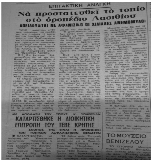
Εικ. 2. Κρητικά Νέα, Ιούλιος 1980.