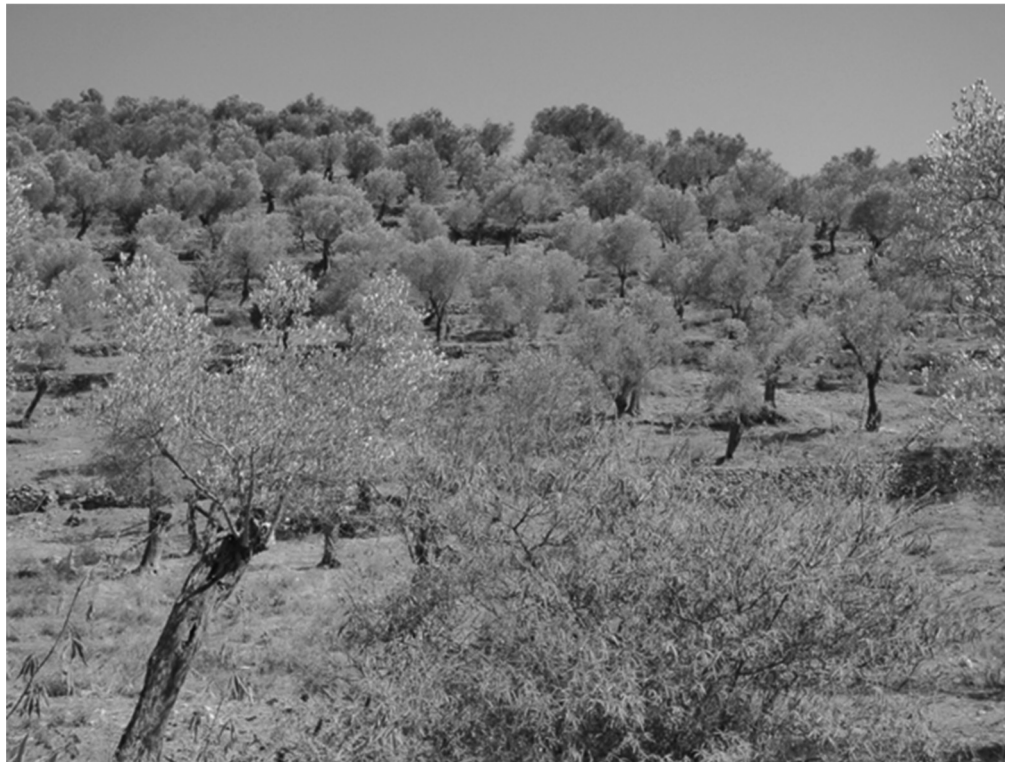
Εικόνα 1. Ελαιώνας κεντρικής Λέσβου.

προσφέρει στον τουρισμό και ευρύτερα στην κοινωνία, με εξαίρεση τον εκπρόσωπο της ΜΟΔΟΥΣΑ που υπεισιήλθε ακόμη και στις πνευματικές, μυθολογικές και αισθητικές παροχές του τοπίου αυτού. Συγκεκριμένα, οι απαντήσεις των ερωτώμενων κυμαίνονταν από πολύ θετικές έως πολύ αρνητικές. Για παράδειγμα, παρότι τα τοπία αυτά είναι ομολογουμένως σε καλή κατάσταση (κατά τον πληροφοριοδότη των «Πράσινων»), ένας πρώην δήμαρχος τόνισε ότι κανείς δεν ενδιαφέρεται για αυτά, καθότι θεωρούνται ως εγκαταλειμμένα τοπία. Τα κύρια προϊόντα τους, όπως απαριθμήθηκαν στις συνεντεύξεις, είναι το ελαιόλαδο, οι ελιές, τα οπωροκηπευτικά και λιγότερο το κρασί, ενώ οι υπηρεσίες που προσφέρουν αναφέρθηκαν κυρίως ως οικολογικές και αγροτικές, με μια μικρή νύξη και στις αναψυχικές, από τον εκπρόσωπο των «Πράσινων».