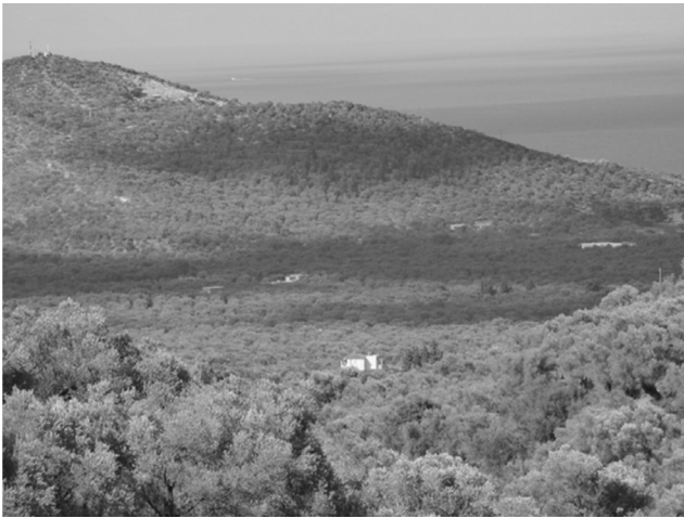
Εικόνα 3. Αγροτικό τοπίο της ανατολικής Λέσβου.

αν και δεν έχουν ακόμη αξιοποιηθεί – με μικρή εξαίρεση δύο πρόσφατες πρωτοβουλίες. Ο εκπρόσωπος των «Πράσινων» και της Φωτογραφικής Λέσχης της Μυτιλήνης αποτίμησε πολύ θετικά τις πιθανότητες τα τοπία αυτά να προσελκύσουν και τους συμβατικούς επισκέπτες ηλιοτροπικού τουρισμού. Ο εκπρόσωπος, όμως, των τουριστικών πρακτόρων Λέσβου τοποθέτησε αυτή την προοπτική στον εξής προβληματισμό: «πιθανόν αγροτουρισμός, αλλά οι αγροτουριστικές επιχειρήσεις που έχουν μέχρι τώρα αναπτυχθεί κάθε άλλο παρά το επέτυχαν [...] Θα μπορούσαν, όμως, να υπάρξουν πραγματικά αγροτουριστικά προϊόντα και υπηρεσίες εδώ, αλλά οι άνθρωποι δεν έχουν οράματα για το μέλλον και εστιάζουν μόνον στο γρήγορο, βραχυπρόθεσμο κέρδος». Γενικότερα, οι εργασίες και παροχές αυτών των τοπίων φαίνεται να είναι δραστηριότητες του πρωτογενούς τομέα (συμπεριλαμβανόμενης και της κτηνοτροφίας, κάποιας ξύλευσης και υποτυπώδους μεταποίησης αγροτικών προϊόντων) με μικρή παρουσία κάποιων κατασκευαστικών εργασιών και αναψυκτικών δραστηριοτήτων.