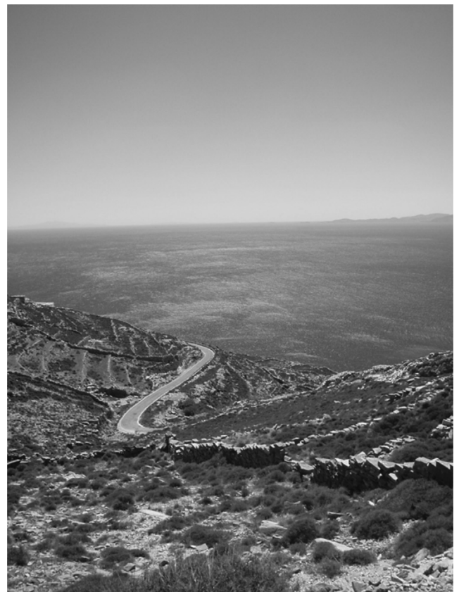
Εικόνα 2. Αγροτικό τοπίο της δυτικής Λέσβου.

Όσον αφορά τον τουρισμό στα αγροτικά τοπία της Λέσβου ειδικότερα, δύο ερωτώμενοι απάντησαν ότι δεν υπάρχει (ένας εκπρόσωπος αγροτικής ένωσης και ένας πρώην δήμαρχος αυτών των περιοχών). Οι δυνατότητες για αγροτουρισμό, οικοτουρισμό και διάφορες άλλες μορφές θεματικού τουρισμού ειδικών ενδιαφερόντων (π.χ. παρατήρηση πουλιών, θρησκευτικός τουρισμός και προσκυνήματα) υποστηρίχθηκαν ιδιαίτερα,