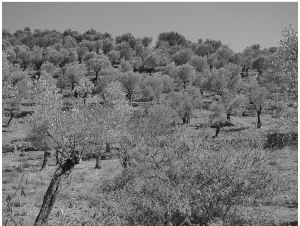
Εικόνα 1. Ελαιώνας κεντρικής Λέσβου.

προσφέρει στον τουρισμό και ευρύτερα στην κοινωνία, με εξαίρεση τον εκπρόσωπο της ΜΟΔΟΥΣΑ που υπεισήλθε ακόμη και στις πνευματικές, μυθολογικές και αισθητικές παροχές του τοπίου αυτού. Συγκεκριμένα, οι απαντήσεις των ερωτώμενων κυμαίνονταν από πολύ θετικές έως πολύ αρνητικές. Για παράδειγμα, παρότι τα τοπία αυτά είναι ομολογουμένως σε καλή κατάσταση (κατά τον πληροφοριοδότη των «Πράσινων»), ένας πρώην δήμαρχος τόνισε ότι κανείς δεν ενδιαφέρεται για αυτά, καθότι θεωρούνται ως εγκαταλειμμένα τοπία. Τα κύρια προϊόντα τους, όπως απαριθμήθηκαν στις συνεντεύξεις, είναι το ελαιόλαδο, οι ελιές, τα οπωροκηπευτικά και λιγότερο το κρασί, ενώ οι υπηρεσίες που προσφέρουν αναφέρθηκαν κυρίως ως οικολογικές και αγροτικές, με μια μικρή νύξη και στις αναψυχικές, από τον εκπρόσωπο των «Πράσινων».