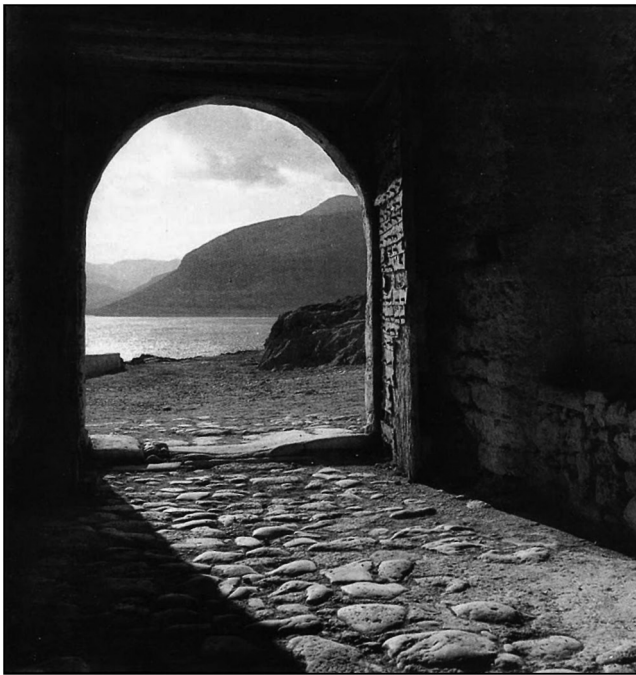
2. Δημήτρης Χαρισιάδης ( http://thestoryofphotography.blogspot.com/2015/01/blog-post_31.html ).

Αυτή όμως η ιδεολογική επένδυση στο τοπίο δεν εμπόδισε την εξαργύρωση των φυσικών και αισθητικών πόρων που το συγκροτούσαν. Η λατρεία των τοπίων, τις τελευταίες δεκαετίες, συνυπάρχει με μια επίμονη αξίωση κατάληψης και μαζί αλλοίωσής τους. Η ασυδοσία διαφόρων εκμεταλλεύσεων, οι πυρκαγιές και οι χωματερές, αλλά κυρίως ο οικοδομικός παροξυσμός των προηγούμενων δεκαετιών είναι ενδεικτικά φαινόμενα. Τα τοπία που ανακαλύφθηκαν και εξυμνήθηκαν από τις προηγούμενες γενιές έχουν γίνει πλέον τρόπαιο των εξοχικών, των παραθεριστικών συγκροτημάτων και της κάθε τύπου τυχοδιωκτικής επιχειρηματικότητας. Όπως γλαφυρά το κωδικοποιεί ο Ηρακλής Παπαϊωάννου η «τοπιολατρία» συχνά συγκαλύπτει την «τοπιομαχία». 4