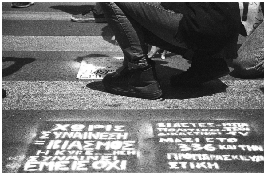
Εικόνα 4: Ακτιβισμοί κατά τη διάρκεια φεμινιστικής πορείας

είτε σε χωρικό επίπεδο, κάποια χρησιμοποιούνται και σήμερα με τον ίδιο τρόπο, κάποια έχουν τροποποιηθεί και έχουν βρεθεί άλλα τόσα νέα. Η δημιουργία μίας καθημερινότητας, ενός νέου δημόσιου χώρου ή ο μετασχηματισμός του δημόσιου χώρου με τέτοιο τρόπο, ώστε να χωράει τις καθημερινές γυναίκες και τα ΛΟΑΤΚΙ+ άτομα, αναδύεται ως κοινός παρονομαστής όλων αυτών των αγώνων.