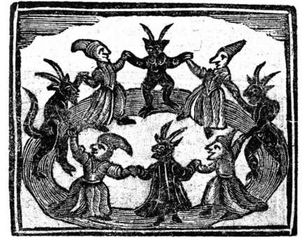
Εικόνες 2-3: Ανώνυμος, Γιορτή Μαγισσών

νους θεσμούς στην ιστορία της κρατικής καταστολής: την Ιερά Εξέταση. Η τιμωρία είναι για τις περισσότερες η πυρά σε πασσάλους σε κεντρικό σημείο της πόλης. Ακόμα και στην περίπτωση που δεν τιμωρούνται με θάνατο, η κοινωνική και η χωρική απομόνωση παίρνουν τον ρόλο του συμβολικού ενταφιασμού, ανάλογα με την Κρύπτη της Αντιγόνης.