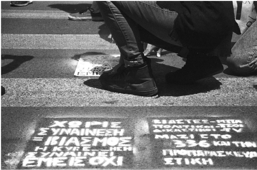
Εικόνα 4: Ακτιβισμοί κατά τη διάρκεια φεμινιστικής πορείας

είτε σε χωρικό επίπεδο, κάποια χρησιμοποιούνται και σήμερα με τον ίδιο τρόπο, κάποια έχουν τροποποιηθεί και έχουν βρεθεί άλλα τόσα νέα. Η δημιουργία μίας καθημερινότητας, ενός νέου δημόσιου χώρου ή ο μετασχηματισμός του δημόσιου χώρου με τέτοιον τρόπο, ώστε να χωράει τις καθημερινές γυναίκες και τα ΛΟΑΤΚΙ+ άτομα, αναδύεται ως κοινός παρονομαστής όλων αυτών των αγώνων.