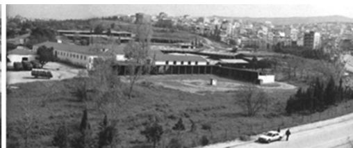
Όψη του στρατοπέδου Παύλου Μελά από την οδό Δαβάκη το 1994