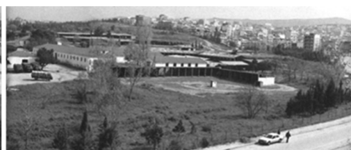
Όψη του στρατοπέδου Παύλου Μελά από την οδό Δαβάκη το 1994