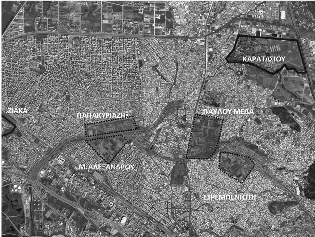
Αεροφωτογραφία της περιοχής της δυτικής Θεσσαλονίκης με τη θέση των στρατοπεδικών εκτάσεων και την περίμετρο παρέμβασης του δυτικού τόξου)

πόλης 3 . Στα κείμενα και τις σχεδιαστικές αναπαραστάσεις – προτάσεις που παρήχθησαν στον διαγωνισμό διακρίνεται με σαφήνεια ότι τα κενά των στρατοπέδων αντιμετωπίζονται κυρίως ως χώροι κοινωφελών δραστηριοτήτων, χωρίς περιορισμούς ως προς το ποσοστό ανοικοδόμησής τους και προκειμένου αυτοί να αποτελέσουν τοπικά κέντρα και πόλους έλξης επισκεπτών στους περιφερειακούς δυτικούς οικισμούς της πόλης. Η κατεύθυνση αυτή εκπορεύεται από μια - χαρακτηριστική για την εποχή - στροφή του ενδιαφέροντος του σχεδιασμού από τα αυστηρότερα και συνολικότερα πλαίσια παρέμβασης της πολεοδομικής κλίμακας προς τα προγράμματα μεγάλης κλίμακας αναπλάσεων – επανάχρησης συγκεκριμένων περιοχών. Πρόκειται για τα «ειδικά προγράμματα» ή τα προγράμματα «μιας επιχείρησης» που χαρακτήρισαν την εποχή αυτή τη μεταμόρφωση της Βαρκελώνης (Busquets, 2005).