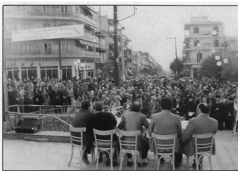
Φωτογραφία από την «παλαική» συγκέντρωση διαμαρτυρίας για την παραχώρηση του στρατοπέδου Στρεμπενιώτη το 1989

όπως οι δημοτικές και διαδημοτικές επιχειρήσεις και οι συνεταιρισμοί διαφόρων μορφών (Τριανταφυλλοπούλου, 2004: 63-69). Πυκνώνουν επίσης και πρωτοβουλίες γύρω από τα θέματα του αναπτυξιακού προγραμματισμού και της επιχειρησιακής οργάνωσης που αποτελούσαν μια καθαρά «εισαγόμενη» μέθοδο οργάνωσης της πολιτικής από την έως τότε εμπειρία της χώρας στον ευρωπαϊκό σχηματισμό (Μαΐστρος, 2009: 51). Ο νέος αυτός «αναπτυξιακός» ρόλος εμπεδώνεται με έναν ιδιαίτερο τρόπο στους πολιτικούς και υπηρεσιακούς αυτοδιοικητικούς κόσμους, κυρίως δε ως συστηματική δράση για την εξασφάλιση των αναγκαίων κοινωφελών υποδομών και τη διεύρυνση των δραστηριοτήτων των δήμων στους τομείς της κοινωνικής πολιτικής και του πολιτισμού (Κούρτη, 2017: 242).