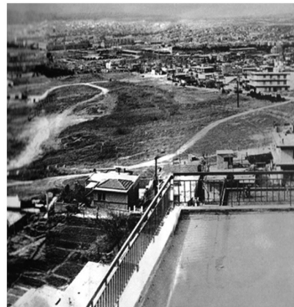
Το πρώην στρατόπεδο Στρεμπενιώτη την δεκαετία του 1970

αφορούσε την υπόθεση της διεκδίκησης (δημόσια έγγραφα, δημοσιεύματα, συνεντεύξεις κλπ.), διαπιστώνεται ότι η δράση του δήμου για παραχώρηση του στρατοπέδου εκδηλωνόταν προς τις εξής κατευθύνσεις: