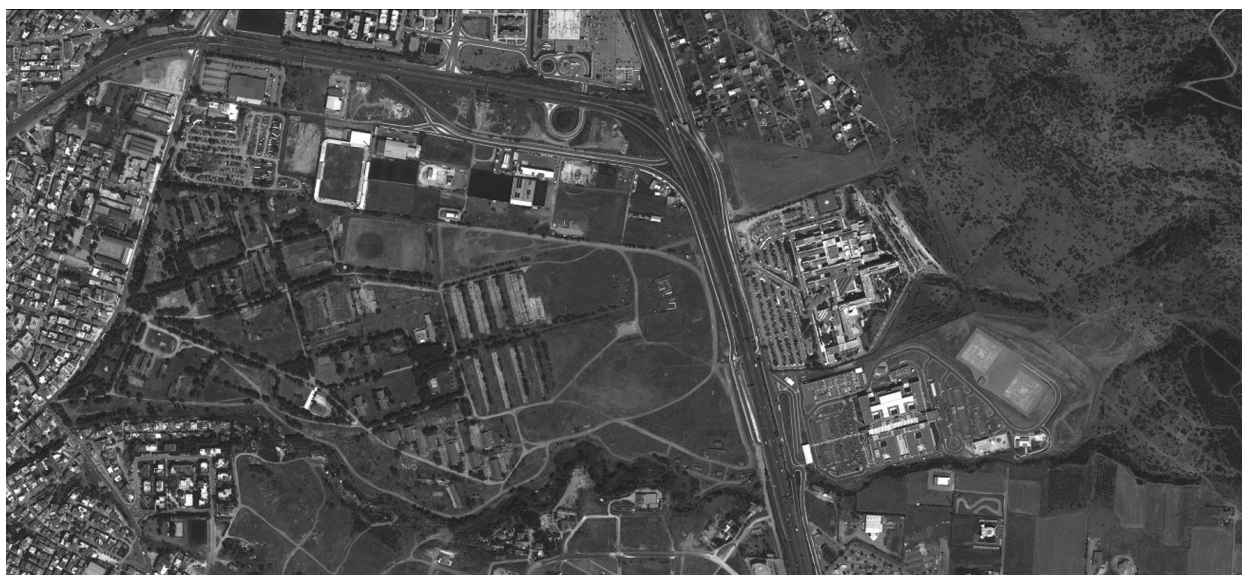
Αεροφωτογραφία του στρατοπέδου Καρατάσιου.

Η περιφερειακή θέση στον πολεοδομικό ιστό, η πολύ μεγάλη έκταση αλλά και το πλούσιο φυσικό τοπίο του στρατοπέδου Καρατάσιου αποτελούν ιδιαιτερότητες που διαμορφώνουν συνθήκες «αμηχανίας» στην διαχείριση του. Το σύνολο της υφιστάμενης σημερινής έκτασης του στρατοπέδου περιλαμβάνεται στη γεωργική διανομή του αγροκτήματος Πολίχνης, φέρει τον χαρακτηρισμό «στρατόπεδο» και καταλογογραφείται στον πίνακα διανομής ως «δημόσιον». Μετά το 1933 και σε διάφορες χρονικές φάσεις, άλλες εκτάσεις προσκυρώθηκαν και άλλες αποσπάστηκαν από την αρχική έκταση του στρατοπέδου. Μετά από τις παραπάνω προσκυρώσεις - αποσπάσεις το εναπομείναν τμήμα του - που ταυτίζεται περίπου ως θέση και έκταση με το τμήμα που σημειώνεται στην αγροτική διανομή του 1933 - φτάνει τα 639 στρέμματα. Το ιδιοκτησιακό καθεστώς του χώρου αποτελεί ένα πολύ σημαντικό και χρόνιο πρόβλημα εφόσον την ιδιοκτησία του χώρου διεκδικούν - από την δεκαετία του '50 και μέσα από συνεχείς διαμάχες - το ΤΕΘΑ και το Υπουργείο Οικονομικών.