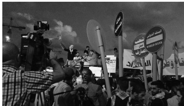
3. Διαδηλωτές στην Πλατεία των Μαρτύρων κατά τη διάρκεια της κρίσης των απορριμμάτων, 8 Οκτωβρίου 2015 (σελ. 20, μετά από «ηγεσία και διοίκησή της.»)

Την ίδια στιγμή, οι αυξανόμενες ανισότητες και η διαφθορά, η συνεχιζόμενη υποβάθμιση των δημόσιων υπηρεσιών, των συνθηκών ζωής και του περιβάλλοντος στον Λίβανο, σε βαθμό που δημιουργεί βαθιά υγειονομική και περιβαλλοντική κρίση, προκάλεσαν μια από τις πιο ενιαίες διαθησκευτικές εκστρατείες ενάντια στην τάξη των πολιτικών και ενάντια στο φατριαστικό σύστημα το καλοκαίρι του 2015. Η χωματερή του Ναάμε, που ήταν η κύρια χωματερή της πόλης από τα μέσα της δεκαετίας του 1990, είχε μείνει σε λειτουργία για δεκαεφτά χρόνια, αντί για τα προγραμματισμένα έξι. Η χωματερή αποτελούσε προσωρινή λύση ώσπου να στηθεί ένα πιο ολοκληρωμένο σύστημα για τη διαχείριση των απορριμμάτων. Κατέληξε όμως να συμβολίζει τη διαφθορά της χώρας και την διασπασμένη ηγεσία και διοίκησή της.