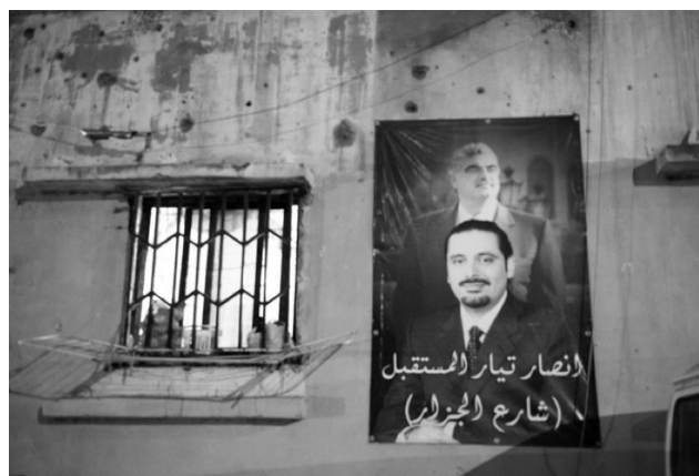
2. Αφίσα των Χαρίρι, πατέρα και γιος, Tariq el-Jdideh, 30 Ιουνίου 2010. (σελ. 7, μετά από «σε τόπο ανοιχτής και συνεχούς διαμφισβήτησης.»)

Ο μετά την Ταϊφ διακανονισμός δημιούργησε επομένως μια κατάσταση, όπου η «κοινή ύπαρξη» των θρησκευτικών κοινοτήτων είναι ο κοινός ορίζοντας, χωρίς προοπτική για σταδιακή συγκρότηση ενός ενιαίου δημόσιου μέσα από την οικοδόμηση του κράτους και την ομογενοποίηση του χώρου. Αυτό καθιστά κατά πολύ ανεφάρμοστη την προσέγγιση, που θεωρεί τον δημόσιο χώρο προϊόν του νεωτερικού κράτους και αντιτιθέμενο σε άλλες μορφές εδαφικοποίησης. Η αστάθεια που χαρακτήρισε τη μετά το 2005 περίοδο, καθώς χαρακτήθηκαν νέες διαχωριστικές γραμμές, συνοδεύτηκε από μια πιο διάχυτη σήμανση του αστικού εδάφους. Οι συνοικίες οριοθετούνται σαφώς, δείχνοντας ότι βρίσκονται κάτω από τον έλεγχο της μίας ή της άλλης πολιτικής παράταξης, με σημαίες, πανό, αφίσες και σύμβολα να πλημμυρίζουν το αστικό περιβάλλον και να σημαδεύουν τον δημόσιο χώρο. Αυτή η «εδαφικοποίηση» της Βηρυτού δεν είναι καινούργια, όμως η ριζοσπαστικοποίηση (radicalisation) αυτών των εδαφικοτήτων και η εντατικοποίηση της αντιπαράθεσής τους μετά το 2005 μετέτρεψε την πόλη, και ιδιαίτερα τη Δυτική Βηρυτό, σε τόπο ανοιχτής και συνεχούς διαμφισβήτησης.