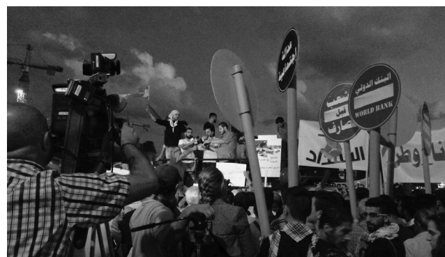
3. Διαδηλωτές στην Πλατεία των Μαρτύρων κατά τη διάρκεια της κρίσης των απορριμμάτων, 8 Οκτωβρίου 2015 (σελ. 20, μετά από «ηγεσία και διοίκησή της.»)

Την ίδια στιγμή, οι αυξανόμενες ανισότητες και η διαφθορά, η συνεχιζόμενη υποβάθμιση των δημόσιων υπηρεσιών, των συνθηκών ζωής και του περιβάλλοντος στον Λίβανο, σε βαθμό που δημιουργεί βαθιά υγειονομική και περιβαλλοντική κρίση, προκάλεσαν μια από τις πιο ενιαίες διαθησκευτικές εκστρατείες ενάντια στην τάξη των πολιτικών και ενάντια στο φατριαστικό σύστημα το καλοκαίρι του 2015. Η χωματερή του Ναάμε, που ήταν η κύρια χωματερή της πόλης από τα μέσα της δεκαετίας του 1990, είχε μείνει σε λειτουργία για δεκαεφτά χρόνια, αντί για τα προγραμματισμένα έξι. Η χωματερή αποτελούσε προσωρινή λύση ώσπου να στηθεί ένα πιο ολοκληρωμένο σύστημα για τη διαχείριση των απορριμμάτων. Κατέληξε όμως να συμβολίζει τη διαφθορά της χώρας και την διασπασμένη ηγεσία και διοίκησή της.