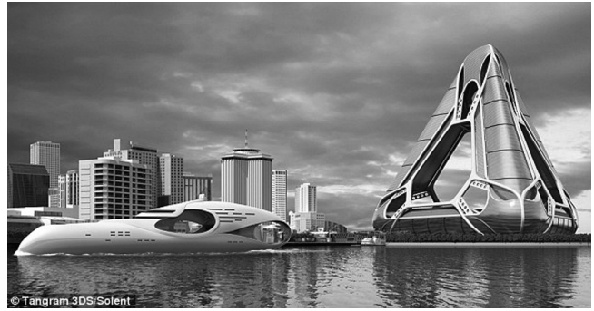
Εικόνα 3: Φωτο από άρθρο της ηλεκτρονικής εφημερίδας Daily Mail Online με τίτλο «Η Νέα Κιβωτός του Νώε: Επιπλέον πόλη που θα μπορούσε να εξαλείψει μετεωρολογικές καταστροφές σαν αυτή του τυφώνα Katrina στη Νέα Ορλεάνη το 2005».

Συμπερασματικά, τα βασικά σύγχρονα διλήμματα στη διαχείριση κινδύνων καταστροφής είναι: