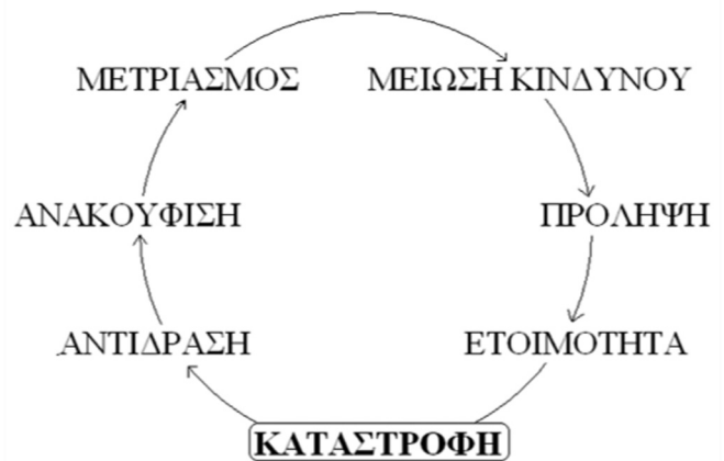
Εικόνα 2: Ο κύκλος διαχείρισης του κινδύνου καταστροφής.

της καταστροφής γίνεται αντιληπτή ως μια κυκλική διαδικασία διαδοχικών διακριτών αλλά διασυνδεδεμένων σταδίων σε καθεμία από τις οποίες αναλαμβάνεται ένα σύνολο δράσεων (Εικόνα 2). Αν θεωρήσουμε ως σημείο αρχής του κύκλου την καταστροφή, ακολουθούν το στάδιο της διαχείρισης της κρίσης (δράσεις έκτακτης ανάγκης και ανακούφισης), της ανασυγκρότησης με δράσεις μετριασμού του κινδύνου και περαιτέρω της μακροπρόθεσμης πρόληψης, και τέλος της βραχυπρόθεσμης ετοιμότητας με την υπόθεση ότι η καταστροφή θα συμβεί αύριο ή είναι ήδη εδώ. Ο κύκλος τονίζει τον αδιάλειπτο χαρακτήρα των προσπαθειών για τη μείωση των απωλειών.