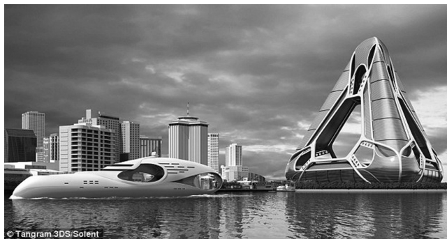
Εικόνα 3: Φωτο από άρθρο της ηλεκτρονικής εφημερίδας Daily Mail Online με τίτλο «Η Νέα Κιβωτός του Νώε: Επιπλέονσα πόλη που θα μπορούσε να εξαλείψει μετεωρολογικές καταστροφές σαν αυτή του τυφώνα Katrina στη Νέα Ορλεάνη το 2005».

Συμπερασματικά, τα βασικά σύγχρονα διλήμματα στη διαχείριση κινδύνων καταστροφής είναι: