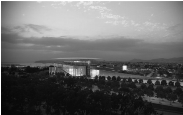
Εικόνα 1. Το νέο κτίριο της Εθνικής Λυρικής Σκηνής