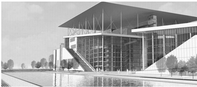
Εικόνα 9: Το κτίριο της όπερας και της βιβλιοθήκης

Η εταιρεία ξεκίνησε τις διαπραγματεύσεις για την παραχώρηση του beach volley και του tae kwondo μετά από τη μετασκευή του σε συνεδριακό κέντρο. Αλληπάλληλες προτάσεις της για τη μετα-ολυμπιακή «αξιοποίηση» του χώρου με νέες αθλητικές και εμπορικές χρήσεις συνάντησαν τη σταθερή εναντίωση των αρχών και των τοπικών κινήσεων των παραλιακών δήμων που αξίωναν τη διαμόρφωση κοινόχρηστου χώρου πρασίνου στο αδόμητο τμήμα της ακτής, σύμφωνα με το ΕΣΟΑΠ του 2002. Οι κινητοποιήσεις κορυφώθηκαν το Μάη 2007, όταν επιχειρήθηκε η περίφραξη της ακτής. Στην Αθήνα αναπτυσσόταν ένα νέο είδος ακτιβισμού για την υπεράσπιση των ελεύθερων δημόσιων χώρων από τις προσπάθειες ιδιωτικοποίησης 22 στις οποίες πρωταγωνιστούσαν τα Ολυμπιακά Ακίνητα.