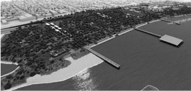
Εικόνα 10: Το πάρκο του Μοσχάτου

χώρος στη θέση της παλιάς παραλίας, με κάποιες «αντιπαροχές» με τη μορφή αθλητικών εγκαταστάσεων από το χορηγό προς το δήμο Καλλιθέας. Ωστόσο, οι τοπικές κινήσεις πολιτών επιμένουν στα σκοτεινά σημεία του σχεδίου σχετικά με την κυριότητα του πάρκου, με την αδιευκρίνιστη δομήσιμη εμπορική επιφάνεια και το ενδεχόμενο της