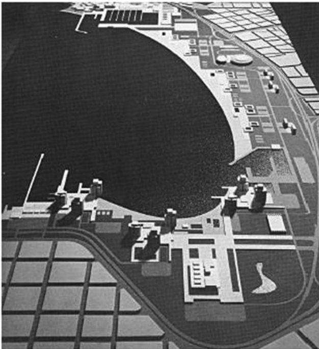
Εικόνα 8: Πρόταση Βαλσαμάκη, Δεκαβάλλα, Μπούγκου.

λουτρικές εγκαταστάσεις και καταστήματα για δεκάδες χιλιάδες κολυμβητές, με την ίδια προσεκτική διαβάθμιση των εισοδηματικών κατηγοριών: Η πλαζ χαμηλών εισοδημάτων προς την Καστέλλα και αυτή των υψηλών εισοδημάτων προς το Δέλτα. Προβλέπεται ακόμα η κατασκευή πρωτεύουσας αρτηρίας για την εξυπηρέτηση των εγκαταστάσεων με ανισόπεδους κόμβους στα δύο άκρα της ακτής και σε απόσταση από τη γραμμή αιγιαλού. «Ετσι, ο αξιοποιούμενος χώρος και δεν ενοχλείται από την πυκνή κυκλοφορία και οπτικά αποκολλάται από την πίσω του περιοχή που βρίσκεται (και θα βρίσκεται για πολύ καιρό ακόμα) σε άθλια κατάσταση» 10 . Δήλωση που δεν μας αφήνει αμφιβολία για το ρεβανσισμό των εκσυγχρονιστικών εγχειρημάτων.