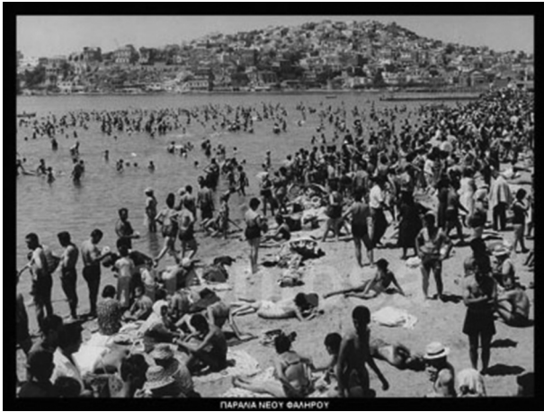
Εικόνα 7: Παραλία Νέου Φαλήρου (στα χρόνια του '60;)

και τις συνεχείς μεταναστευτικές εισροές στην περιοχή (Μπελαβίλας, 2001). Οι νοσταλγικές αναφορές στην