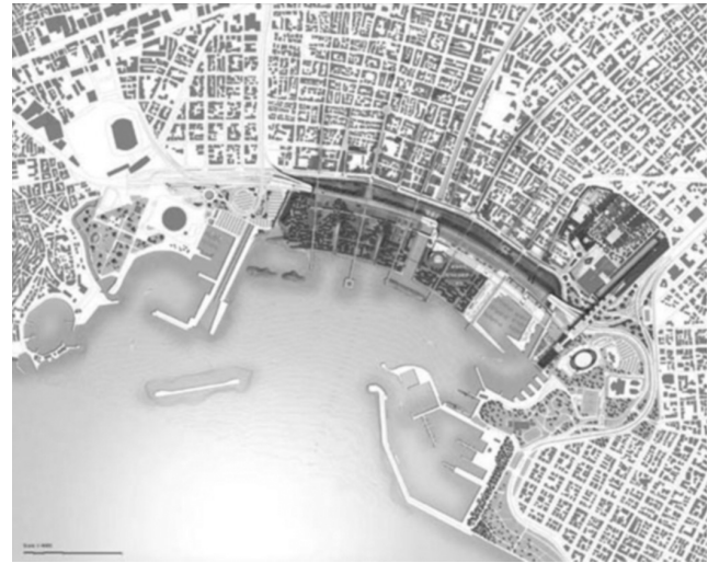
Εικόνα 2: Γενικό σχέδιο του έργου ανάπλασης

Το σενάριο παρασιωπά, βέβαια, τη μακρυνά διαδικασία αποεπένδυσης ή και σκόπιμης καταστροφής που, πριν από τους τόπους, έχει υποβαθμίσει τη ζωή των ανθρώπων που κάποτε τους κατοίκησαν ή ακόμα τους κατοικούν, που τους θυμούνται και τους διεκδικούν όχι σαν μεταφορά αλλά σαν τρόπο να ζουν, των ανθρώπων που βιώνουν τον αποκλεισμό όταν αφήνουν τους τόπους πίσω τους. Αυτή η ζωή δεν έχει τόπο ούτε και λόγο στα προγράμματα «αναζωογόνησης» (Doucet, 2007: 11) κι όμως αναπνέει, κινείται στο περιθώριό τους, υπογραμμίζει έμπρακτα τις αστοχίες τους και τους αντιστέκεται. Παράγει το δικό της χώρο, από το υλικό ονείρων εκτός εμπορίου.