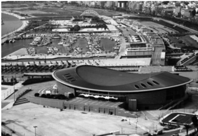
Εικόνα 3: Το κλειστό στάδιο του Tae kwondo

Κάτι που επανέρχεται διαρκώς στη συζήτηση είναι το μέγεθος, η πιο κρίσιμη παράμετρος στην κούρσα του ανταγωνισμού: χιλιάδες οι προβλεπόμενες θέσεις εργασίας, εκατομμύρια ευρώ που θα επενδυθούν σ' αυτήν ή την άλλη φάση του προγράμματος, χιλιάδες τετραγωνικά μέτρα για το συνεδριακό κέντρο, την όπερα, τις εγκαταστάσεις αναψυχής, χιλιάδες οι προβλεπόμενες θέσεις συνόδων, οι κλίνες, οι αφίξεις. Συγκρίσεις επενδυτικών μεγεθών και κινδύνων, λεπτομέρειες για διαπραγματεύσεις, συμφωνίες, ζητήματα διαχείρισης.