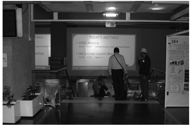
Εντός του χώρου του συνεδρίου – άνω επίπεδο πόστερ παρουσιάσεων.

ences et de l'industrie», συνέρρευσαν πάνω από 2.000 συμμετέχοντες από πλήθος Πανεπιστημίων και Ερευνητικών Ινστιτούτων προκειμένου να παρουσιάσουν τα αποτελέσματα της πρόσφατης ερευνητικής δουλειά τους στη διεθνή επιστημονική κοινότητα και να ανταλλάξουν ιδέες και προτάσεις με συναδέλφους τους από όλο τον κόσμο. Κάθε ημέρα έκλεινε με την ομιλία ενός κύριου ομιλητή στο κεντρικό αμφιθέατρο ενώ οι συνεδρίες λάμβαναν χώρα παράλληλα και διεξήχθησαν σε 3 αμφιθέατρα και 6 αίθουσες. Κατά τη διάρκεια του συνεδρίου διοργανώθηκαν επτά συν-συνεδριακές εκδρομές ενώ μετά το πέρας αυτού πραγματοποιήθηκαν άλλες έξι μετα-συνεδριακές, οι οποίες συντονίστηκαν από Γάλλους, Ιταλούς και Αυστριακούς γεωμορφολόγους. Οι εκδρομές έγιναν με τη βοήθεια δέκα επτά Πανεπιστημίων από τη Γαλλία και τριών από τη Ελβετία και την Ιταλία. Εκτός από τις περιλήψεις των ανακοινώσεων και το πρόγραμμα του συνεδρίου που μοιράστηκαν σε ψηφιακή μορφή, στους συμμετέχοντες δόθηκαν επίσης δύο βιβλία σχετικά με τη γεωμορφολογία της Γαλλίας: το «Géomorphologie de la France» coordinated του D. Mercier (Dunod), και το «Landscapes and Landforms of France» με επιμέλεια των M. Fort και M.F. André.