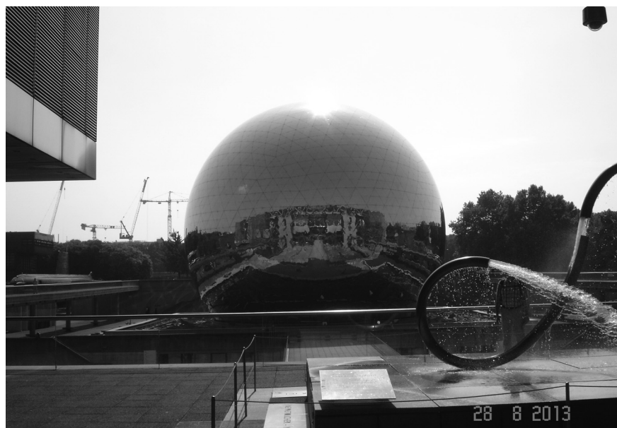
Ο εντυπωσιακός χώρος του κέντρου όπου έλαβε χώρα το συνέδριο.

Κατά τη διάρκεια των 5 ημερών του συνεδρίου, στις συνεδριακές εγκαταστάσεις του κέντρου «Cité de sci-