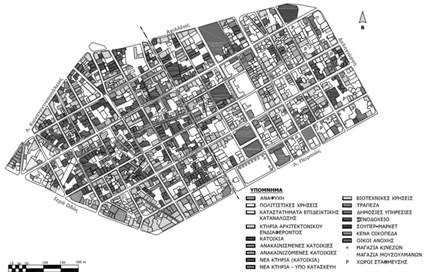
Χάρτης 2: Χρήσεις γης στο Μεταξουργείο, καλοκαίρι 2013, προσωπική καταγραφή, ©Γ. Αλεξανδρή

εταιρείας Oligos με την τοπική και την κεντρική εξουσία, εταιρεία η οποία κατέχει περίπου το 4% των ακινήτων της περιοχής το οποίο χρησιμοποιείται μέχρι τώρα (2013) μόνο για καλλιτεχνικές δράσεις και εκθέσεις, θεσμοθετούνται φορολογικά κίνητρα για την αποκατάσταση νεοκλασικών κτηρίων, εντατικοποιείται η αστυνόμευση και