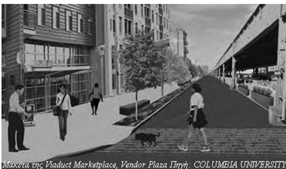
Εικόνα 4. Μακέτα δρόμου και πλατείας στο Ανατολικό Χάρλεμ.