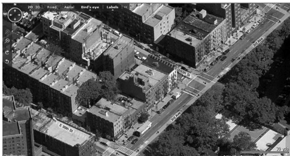
Εικόνα 3. Η περιοχή όπου αναπτύχθηκε το κίνημα για τη δικαιοσύνη στη γειτονιά.

marketplace and vendor plaza» σε αυτό το σχέδιο, για το Ανατολικό Χάρλεμ βλέπουμε την πρόθεση «εξευγενισμού» της περιοχής. Μια πόλη που δεν θα έχει χώρο για τους αфро- και λατινο-αμερικανούς, που συζητούν στους δρόμους και κάθονται στα κατώφλια, αλλά μόνο για όσους θα μπορούν να πληρώσουν για να καθίσουν σε ιδιωτικές καφετερίες, που ονομάζονται ωστόσο νέοι δημόσιοι χώροι. Απέναντι σε αυτό το σχέδιο, αναπτύχθηκε τα τελευταία χρόνια «το κίνημα για τη δικαιοσύνη στη γειτονιά» (Εικόνα 5).