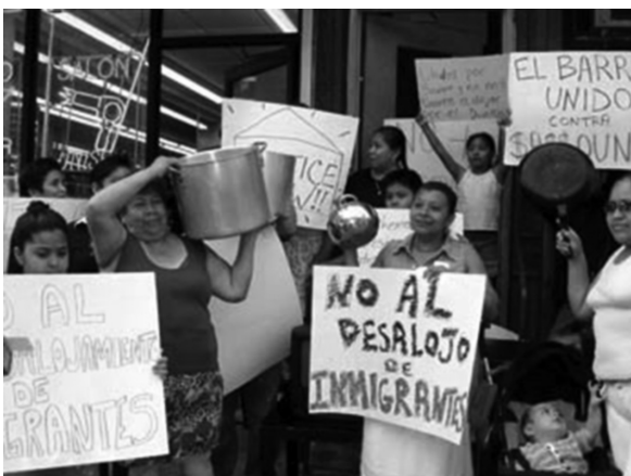
Εικόνα 5. Διαμαρτυρία του κινήματος για τη δικαιοσύνη στη γειτονιά.