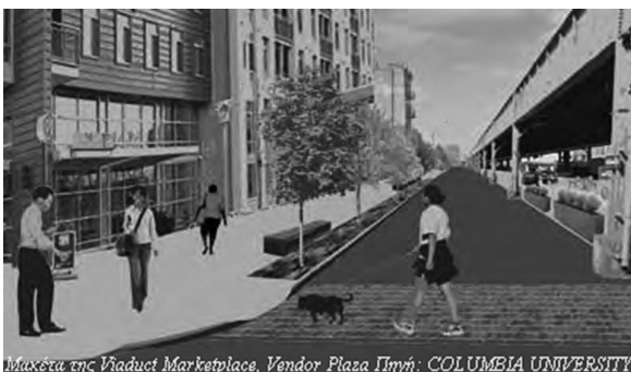
Εικόνα 4. Μακέτα δρόμου και πλατείας στο Ανατολικό Χάρλεμ.