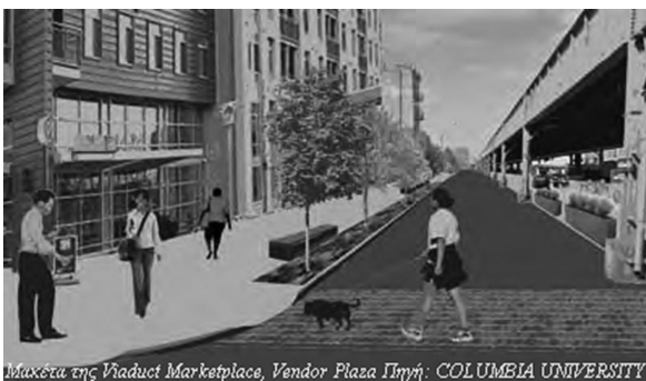
Εικόνα 4. Μακέτα δρόμου και πλατείας στο Ανατολικό Χάρλεμ.