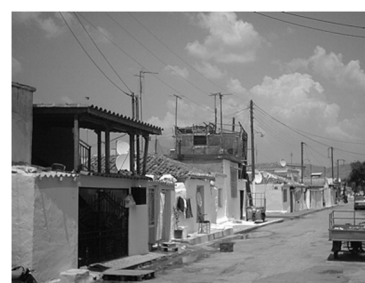
Εικόνα 15: Μια από τις οικιακές χρήσεις (πλύσιμο ρούχων) γίνονται ακόμα και στην είσοδο του σπιτιού.