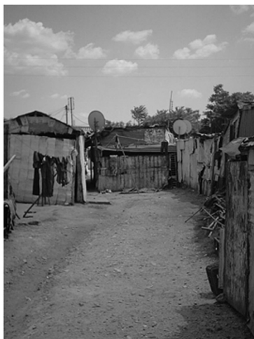
Εικόνα 17: Κοινόχρηστοι και ιδιωτικοί χώροι που τέμνονται καθώς και δορυφορικές κεραίες για λήψη καναλιών άλλων χωρών.

ξης των τσιγγάνικων οικισμών σε πολεοδομημένες περιοχές, με ταυτόχρονη αναβάθμιση του οικιστικού περιβάλλοντός τους, ταυτόχρονα με άλλα προγράμματα –τα περισσότερα με ευρωπαϊκή χρηματοδότηση– που στοχεύουν στην αποκατάσταση και βελτίωση του κοινωνικού ιστού. Χαρακτηριστικό παράδειγμα αποτελεί ο οικισμός Δροσερού στην πόλη της Ξάνθης, που στο Γενικό Πολεοδομικό Σχέδιο του Δήμου Ξάνθης έχει κηρυχθεί περιοχή προς ανάπλαση και ζώνη ειδικών ενισχύσεων και κινήτρων.