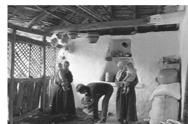
Εικόνα 8: Οικογένεια Πομάκων μέσα στο χαγιάτι.