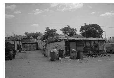
Εικόνα 16: Παραπήγματα κατοικιών στη συνοικία Αλάν Κουγιού στην Κομοτηνή.