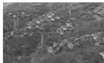
Εικόνα 1: Νυμφαία Ροδόπης. Οι μαχαλάδες.

Αντίθετα τα πομακοχώρια της Ξάνθης εμφανίζουν συνεκτικότερη πολεοδομική συγκρότηση (βλ. Εικόνα 4), με αγροτική παραγωγή (και κυρίως καπνοκαλλιέργεια) περισσότερο ανεπτυγμένη. Τα περισσότερα είναι παραδοσιακής αρχιτεκτονικής και παρουσιάζουν ιδιαίτερο ενδιαφέρον. Έχουν κτιστεί στις παρυφές των βουνών και αυτό έχει επηρεάσει τη δομή και το σχήμα των σπιτιών, όπως επίσης και το εσωτερικό δίκτυο των δρόμων των οικισμών (Κίζης 1990). Τα παραδοσιακά σπίτια εμφανίζεται να έχουν δύο με τρεις ορόφους στο μέρος όπου το επίπεδο του δρόμου είναι το χαμηλότερο, και έναν με δύο ορόφους στο υψηλότερο επίπεδο. Το κυριότερο χαρακτηριστικό τους είναι τα πολλά στενά παράθυρα