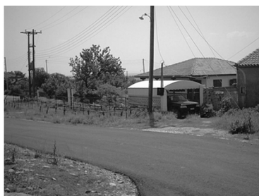
Εικόνα 13: Χριστιανική κατοικία στο μικτό χωριό Μίσχο, όπου διακρίνεται ο εξωτερικός προσανατολισμός και η έλλειψη περιμετρικού μανδρότοιχου.