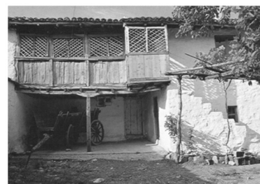
Εικόνα 7: Δρασιά Ροδόπης. Στο χαγιάτι καφασωτό, όπου από κάτω σταθμεύει ο αραμπάς.

Στους μεγαλύτερους και πιο δυναμικούς πομάκικους οικισμούς (Σμίνθη, Εχίνος κ.ά.) παρατηρείται τα τελευταία χρόνια αύξηση της δόμησης και παραγωγή νέων οικοδομών. Το αρχιτεκτονικό πρότυπο των κατασκευών αυτών δεν διατηρεί στοιχεία της παραδοσιακής πομάκικης κατοικίας, αλλά είναι πανομοιότυπο με τις συνηθισμένες κατασκευές στα περισσότερα χωριά της ελληνικής υπαίθρου, και μάλιστα εκεί όπου δεν υπάρχουν αρχιτεκτονικοί περιορισμοί και οι πολεοδομικοί έλεγχοι είναι χαλαροί (βλ. Εικόνες 9-10).