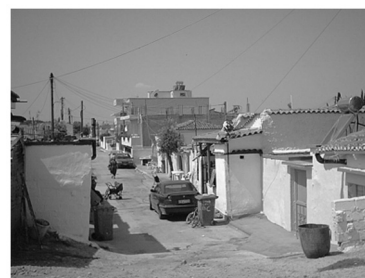
Εικόνα 14: Ήφαιστος Ροδόπης. Οικισμός Αθίγγανων δίπλα στην Κομοτηνή. Έντονη πολυχρωμία.

Για τους οικισμούς των τσιγγάνων δεν μπορεί να γίνει γενική αναφορά σε σχετική πολεοδομική νομοθεσία, καθώς ή είναι οικισμοί που ανήκουν σε ευρύτερα πολεοδομικά συγκροτήματα και ακολουθούν την πολεοδομική νομοθεσία αυτών των πολεοδομικών συγκροτημάτων ή είναι αυθαίρετοι οικισμοί και επομένως δεν ακολουθούν καμία πολεοδομική νομοθεσία. Τελευταία γίνονται προσπάθειες έντα-