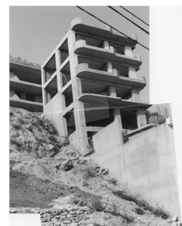
Εικόνα 10: Κατασκευή νεοελληνικού προτύπου στον οικισμό Μύκης, 2002.