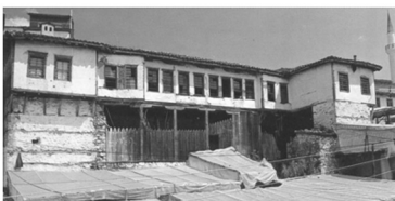
Εικόνα 6: Νοικοκυρόσπιτο στο Εχίνο Ξάνθης.