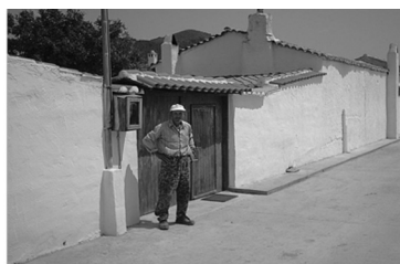
Εικόνα 12: Μονώροφη κατοικία σε σοκάκι του χωριού Μίσχο. Χαρακτηριστικός είναι ο ψηλός μανδρότοιχος που εμποδίζει τον πεζό να δει εσωτερικά την αυλή και το σπίτι του ιδιοκτήτη. Ευδιάκριτη είναι η σκεπαστή δίφυλλη μεγάλη αυλόπορτα που επιτρέπει την είσοδο τροχοφόρων.