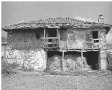
Εικόνα 5: Δρασιά Ροδόπης: Δίχωρο σπίτι.

Οι πομάκικοι οικισμοί κατατάσσονται στους οικισμούς προ του 1923. Σχέδια πόλεων δεν έχουν γίνει ποτέ και επεκτάσεις οικισμών δεν επιτράπηκαν. Επίσης, στη Νομαρχία Ξάνθης δεν έχει γίνει οριοθέτηση για κανέναν από αυτούς τους οικισμούς. Αντίθετα, οριοθέτηση πραγματοποιήθηκε στο σύνολο σχεδόν των οικισμών με πληθυσμό κάτω των 2.000 κατοίκων στις γειτονικές Νομαρχίες Ροδόπης και Έβρου από το 1992 μέχρι και σήμερα. Στους μη οριοθετημένους οικισμούς, η δόμηση γίνεται σύμφωνα με το διάταγμα των οικισμών προ του 1923, με όλες τις γνωστές αναχρονιστικές παρενέργειες της διαδικασίας αυτής (Lalenis 2000). Πρέπει τέλος να σημειωθεί ότι, παρά την πανθομολογούμενη εξαιρετική ομορφιά των οικισμών αυτών και της παραδοσιακής αρχιτεκτονικής τους, κανένας δεν έχει κηρυχθεί παραδοσιακός, και σε κανέναν δεν έχει τεθεί μέτρο προστασίας πολιτιστικής κληρονομιάς. Σήμερα η εκτεταμένη ανοικοδόμηση έχει μεταφέρει ημιαστικά πρότυπα (μικρές πολυκατοικίες, μπαλκόνια, μετόν) και έχει μετατρέψει σε μεγάλο βαθμό την παραδοσιακή μορφή των οικισμών ιδιαίτερα στα κεφαλοχώρια όπου η στεγαστική πίεση είναι μεγαλύτερη (π.χ. Εχίνος νομού Ξάνθης).