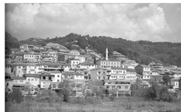
Εικόνα 4: Η συνεκτική πολεοδομική συγκρότηση του Εχίνου Ξάνθης.