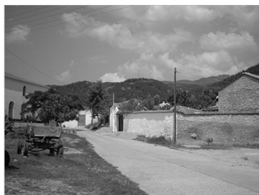
Εικόνα 11: Είναι ευδιάκριτη η διάσπαρτη δόμηση και οι πολλοί ανοιχτοί χώροι που υπάρχουν στο χωριό Μίσχο.

Οι οικισμοί των μειονοτικών Τούρκων βρίσκονται κυρίως στη νότια και πεδινή περιοχή της Δυτικής Θράκης. Κύρια ασχολία των κατοίκων είναι κυρίως η γεωργία και λιγότερο η κτηνοτροφία. Σ' αυτούς τους οικισμούς το εσωτερικό οδικό δίκτυο είναι ευρύ και εκτεταμένο και υπάρχουν ανοιχτές εκτάσεις που μπορούν να διαμορφωθούν σε κοινόχρηστους χώρους. Παράλληλα, τα περισσότερα σπίτια είναι συνήθως ισόγεια και σπανιότερα διώροφα. Κύριο δομικό υλικό είναι οι ωμόπλινθοι παλαιότερα και οι οπτόπλινθοι σήμερα (Κατσιμίγας 1984, Κίζης 1990). Η στέγη είναι φτιαγμένη κυρίως από κεραμίδια με ενδιαφέρουσες ποικιλόμορφες καπνοδόχους. Επίσης, σ' αυτά τα χωριά δεν συναντά κανείς μεγάλες πυκνότητες πολεοδομικού ιστού καθώς τα σπίτια κτίζονται είτε μόνα τους είτε σαν μέρος ομάδας, αρκετά απομακρυσμένα το ένα από το άλλο (Lalenis 2000). Οι τεχνικές και οι κοινωνικές υποδομές, εκτός της «ευρυχωρίας» του οδικού δικτύου, παρουσιάζουν ελλείψεις παρόμοιες με αυτές των πομάκικων οικισμών. Τέλος, οι οικισμοί της τουρκικής μειονότητας διαφέρουν από τους χριστιανικούς των ίδιων περιοχών κατά το ότι στους πρώτους ψηλοί μανδρότοιχοι εμποδίζουν τον πεζό να δει εσωτερικά την αυλή και το σπίτι του ιδιοκτήτη (βλ. Εικόνες 11-12), ενώ στους δεύτερους όλα τα σπίτια είναι ορατά (βλ. Εικόνες 13), με εξωτερικό προσανατολισμό στις πόρτες, τα παράθυρα και τα μπαλκόνια τους.