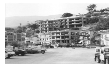
Εικόνα 9: Καταστροφή του παραδοσιακού περιβάλλοντος των μειονοτικών οικισμών. Οικισμός Σμίνθης, 2002.