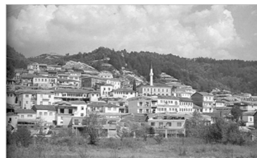
Εικόνα 4: Η συνεκτική πολεοδομική συγκρότηση του Εχίνου Ξάνθης.