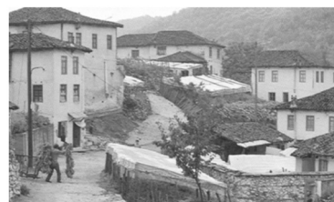
Εικόνα 2: Μαχαλάδες στις Σάτρες Ξάνθης.