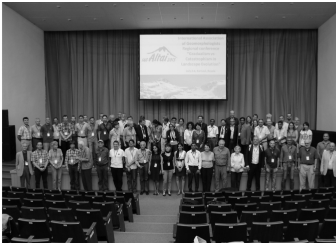
Ομαδική φωτογραφία των συνέδρων στην τελετή λήξης του συνεδρίου.

εκδρομή 8 ημερών γεωμορφολογικού και γεωαρχαιολογικού κυρίως ενδιαφέροντος στην περιοχή της λίμνης Βαϊκάλη και μια μετασυνεδριακή επτάημερη εκδρομή στη λίμνη Teletskoye και στα βουνά Αλτάι με θεματολογία σχετική με τις μεγάλες αιφνίδιες παγετώδεις πλημμύρες της περιόδου του Ανώτερου Πλειστόκαινου. Στη μετασυνεδριακή αυτή εκδρομή συμμετείχαν 48 γεωμορφολόγοι από 21 διαφορετικές χώρες μεταξύ των οποίων και 16 νέοι γεωμορφολόγοι από 9 χώρες όπου παρακολούθησαν το εντατικό πρόγραμμα για νέους γεωμορφολόγους που διεξήχθη παράλληλα με την εκδρομή και είχε τη μορφή συζητήσεων και σεμιναρίων πάνω σε θέματα που παρουσιάστηκαν στο πρόγραμμα της εκδρομής. Η συμμετοχή των νέων αυτών επιστημόνων στο συνέδριο καθώς και στην εκδρομή και το εντατικό πρόγραμμα χρηματοδοτήθηκε από τη Διεθνή Ένωση Γεωμορφολόγων αλλά και από την Διεθνή Ένωση Τεταρτογενούς. Κριτήριο για τις υποτροφίες στους νέους γεωμορφολόγους ήταν το νεαρό της ηλικίας των αιτούντων, το βιογραφικό και η χώρα προέλευσης καθώς δόθηκε προτεραιότητα σε λιγότερο ευνοημένες χώρες της Ασίας και της Ευρώπης. Ιδιαίτερα σημαντική για το εντατικό πρόγραμμα εκπαίδευσης των νέων γεωμορφολόγων ήταν η καθοδήγηση από τους Καθηγητές Paul Carling (Πανεπιστήμιο του Southampton, Μεγάλη Βρετανία) και Juergen Herget (Πανεπιστήμιο της Βόννης, Γερμανία) οι οποίοι έχουν πλούσιο δημοσιευμένο έργο σχετικά με τη θεματολογία και την ευρύτερη περιοχή που πραγματοποιήθηκε η εκδρομή.