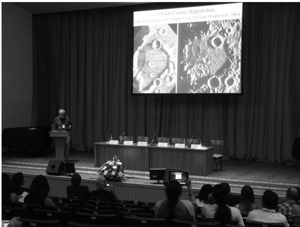
Η εναρκτήρια διάλεξη του προσκεκλημένου Ομιλητή Victor Baker, Καθηγητή στο Τμήμα Υδρολογίας και Υδατικών Πόρων του Πανεπιστημίου της Αριζόνα, ΗΠΑ.

Στο πλαίσιο του συνεδρίου διοργανώθηκε μια προσυεδριακή