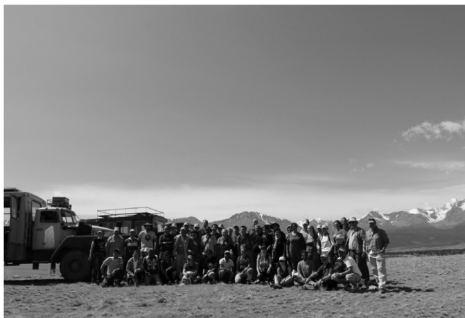
Ομαδική εκδρομή των γεωμορφολόγων που παρακολούθησαν τη μετασυνεδριακή εκδρομή στα βουνά Αλτάι.