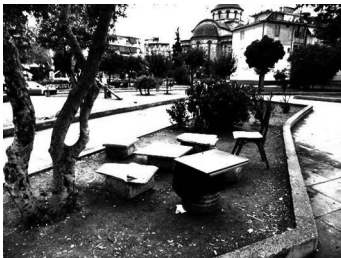
Εικόνα 5: “Επίπλωση”

Στην ίδια πλατεία, εντοπίζεται μία κοινότητα Αιγυπτίων Κοιτών, η οποία δεν έχει πολλές επαφές με τους υπόλοιπους θαμώνες, αλλά ούτε και συγκρούσεις. Το γεγονός πως οι άνθρωποι αυτοί είναι χριστιανοί οικογενειάρχες, τους καθιστά πιο “οικείους” στα μάτια των ντόπιων. Οι έννοιες του