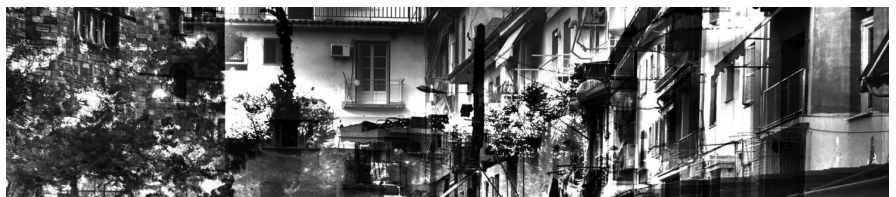
Εικόνα 7: “Μετεωρισμός”

Αν και είναι εμφανής η υπερβολή της περιγραφής και η απροσδιοριστία