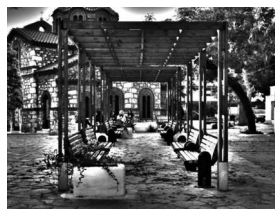
Εικόνα 3: Μεταμόρφωση