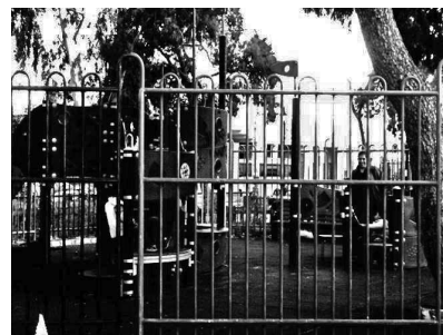
Εικόνα 4: Παιδότοπος]