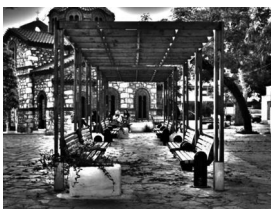
Εικόνα 3: Μεταμόρφωση