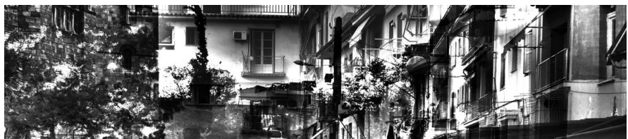
Εικόνα 7: “Μετεωρισμός”

Η πλατεία των Αγ. Αναργύρων έχει διαφορετική συγκρότηση από εκείνη της Μεταμόρφωσης. Ο χώρος παραμένει ενιαίος, όπως είχε σχεδιαστεί εξ’ αρχής. Τις περιοχές πρασίνου διασχίζουν ευρύχωροι πλακοστρωμένοι διάδρομοι, πάνω σε γεωμετρικές χαράξεις που συγκλίνουν προς το κέντρο της πλατείας, όπου συγκεντρώνονται οι