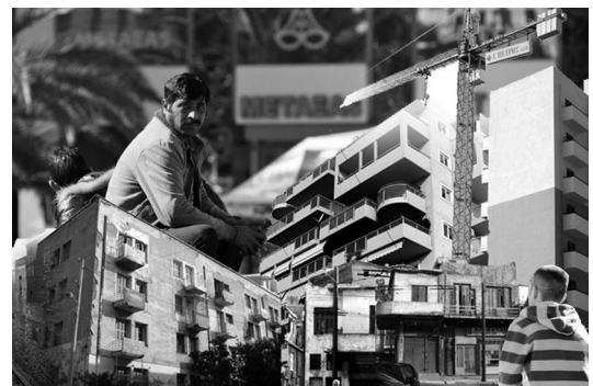
Εικόνα 1: Μετανάστες στα αστικά κέντρα