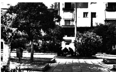
[Εικόνα 6: Αγ. Ανάργυροι

“οικείου” και του “ξένου” έχουν τόσο χωρική, όσο και κοινωνική υπόσταση, καθώς και πολλές διαβαθμίσεις. Οι “αντιδράσεις” των ντόπιων, απέναντι σε κάποιους από τους μετανάστες της περιοχής, δεν στηρίζονται τόσο στους ανταγωνισμούς που αναπόφευκτα έχει επιφέρει η οικονομική κρίση στα μεσαία και κατώτερα στρώματα.