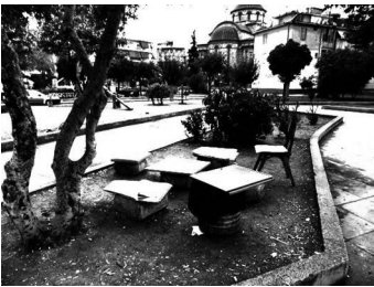
Εικόνα 5: “Επίπλωση”

Στην ίδια πλατεία, εντοπίζεται μία κοινότητα Αιγυπτίων Κοιτών, η οποία δεν έχει πολλές επαφές με τους υπόλοιπους θαμώνες, αλλά ούτε και συγκρούσεις. Το γεγονός πως οι άνθρωποι αυτοί είναι χριστιανοί οικογενειάρχες, τους καθιστά πιο “οικείους” στα μάτια των ντόπιων. Οι έννοιες του