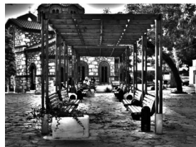
Εικόνα 3: Μεταμόρφωση