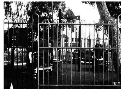
Εικόνα 4: Παιδότοπος]