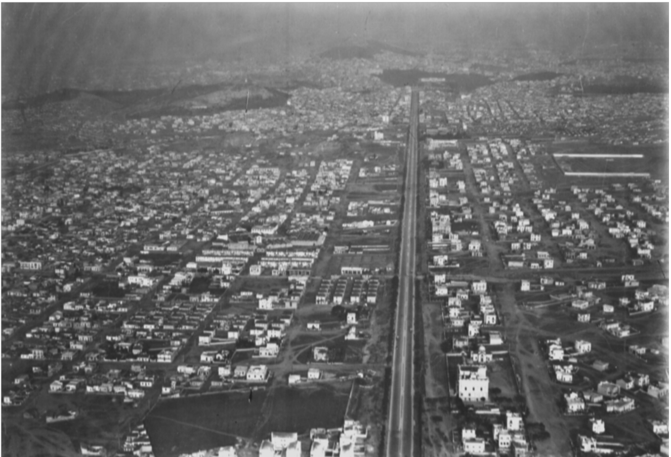
Αττική, 1932.

Εθνικό Ίδρυμα Ερευνών και Μελετών «Ελευθέριος Κ. Βενιζέλος»