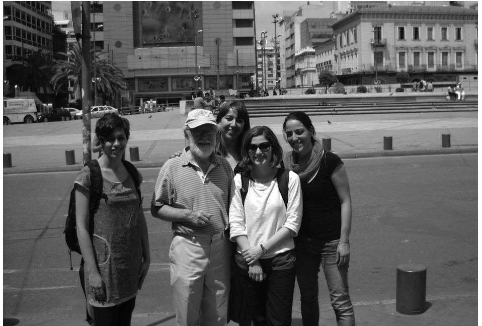
Ο Ντ. Χάρβεϋ στην Ομόνοια με μέλη της ομάδας συνέντευξης, Μάιος 2011.

σε γκέτο, αυτοί είναι οι πλούσιοι κάτοικοι των πόλεων. Το Μανχάταν, για παράδειγμα, είναι σήμερα ένα γκέτο των πλουσίων. Αυτό προέκυψε όταν, στις περιοχές με αυξημένες συγκεντρώσεις μεταναστών, ασκήθηκαν πολιτικές εκτοπισμού τους προς τα προάστια. Από την άλλη, οι μετανάστες που ζουν σήμερα στις ΗΠΑ δεν συγκροτούν μία ενιαία κατηγορία, αλλά ένα πολύ διαφοροποιημένο σύνολο, από εργαζόμενους υψηλής κατάρτισης, που μπορεί να μένουν στο κέντρο του Μανχάταν, μέχρι πρόσφυγες που συγκεντρώνονται αναγκαστικά σε προάστια χαμηλών εισοδημάτων. Επομένως, το να μιλήσει κανείς σήμερα γενικώς για μετανάστες που ζουν σε «γκέτο» δεν ευσταθεί, εφόσον κάθε μεταναστευτικός πληθυσμός είναι και εσωτερικά διαφοροποιημένος, κυρίως ταξικά.