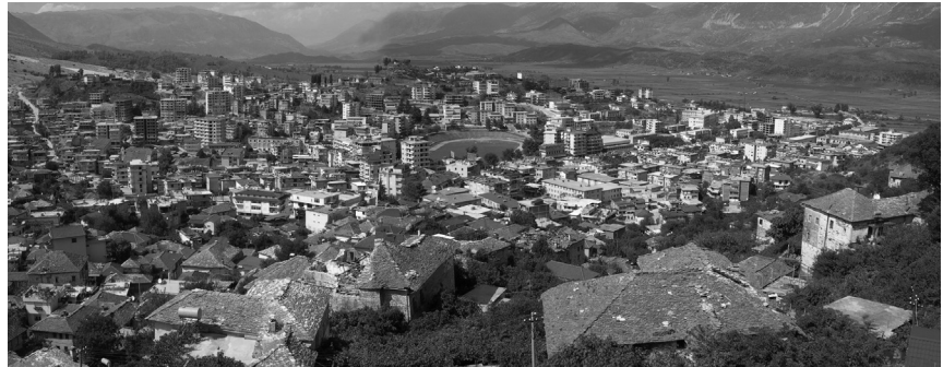
Εικόνα 2: Πανοραμική άποψη του Αργυροκάστρου.

ιδρύεται και το αλβανικό κράτος. Μετά τον Β΄ Παγκόσμιο Πόλεμο τα σύνορα γίνονται σχεδόν αδιαπέραστα, οριοθετώντας δύο επικράτειες που οργανώνονται με βάση διαφορετικό πολιτικό σύστημα και ακολουθούν διαφορετικά μοντέλα ανάπτυξης. Ένας γεωγραφικός χώρος που για πολλούς αιώνες λειτουργούσε ως ενιαίο σύνολο με εσωτερικές κοινωνικές και παραγωγικές σχέσεις διασπάται και οι άνθρωποι βιώνουν άμεσα την απαγόρευση επικοινωνίας.