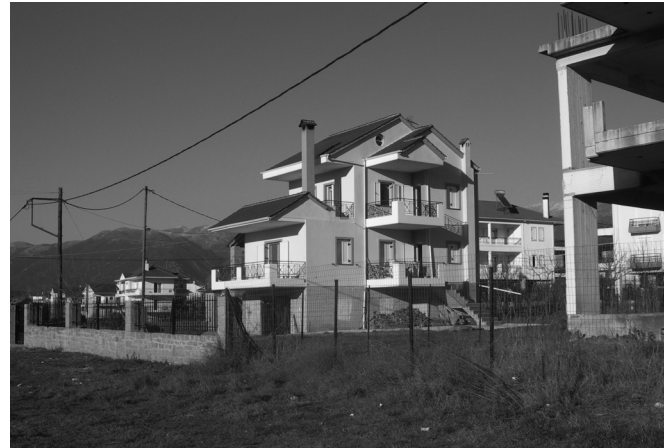
Εικόνα 4: Μονοκατοικία στις επεκτάσεις των Ιωαννίνων.