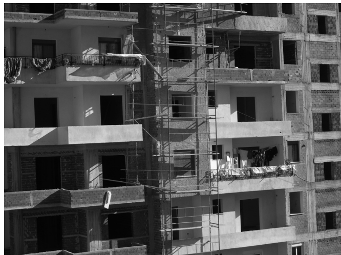
Εικόνα 6: Πολυκατοικία αντιπαροχής στο Αργυρόκαστρο. Οι εργασίες στα διαμερίσματα ολοκληρώνονται από τους αγοραστές σε διαφορετικές φάσεις.

από τη δραστηριοποίηση στον τομέα της οικοδομής. Συγκεκριμένα, από την παραγωγή κατοικίας προκύπτει ότι οι διαφοροποιήσεις στο χαρακτήρα του άτυπου μεταξύ ελληνικής και αλβανικής επικράτειας ενισχύουν τις διαπεριφερειακές σχέσεις, αλληλεξαρτήσεις και ροές και διαμορφώνουν μία ιδιαίτερα δυναμική σχέση μεταξύ των Ιωαννίνων και του Αργυροκάστρου. Για παράδειγμα, οι σχέσεις των τοπικών εργολάβων με τις τοπικές αρχές στο Αργυρόκαστρο είναι τόσο ισχυρές που αποκλείουν εργολάβους από την Ελλάδα, ενώ στα Γιάννενα τέτοιες σχέσεις χρειάζονται μόνο για μεγάλα έργα. Επίσης η φθινή και ανασφάλιστη εργασία των απασχολούμενων στην οικοδομή αντιστοιχεί σε διαφορετικές απολαβές στη μία και την άλλη πλευρά των συνόρων. Προκύπτει δηλαδή ότι η ανάπτυξη άτυπων δραστηριοτήτων σε ένα διεθνικό περιβάλλον δημιουργεί ευκαιρίες και διόδους για διαφορετικά κοινωνικά στρώματα και ομάδες οικονομικών συμφερόντων, διευρύνοντας τη συμμετοχή όλο και περισσότε-