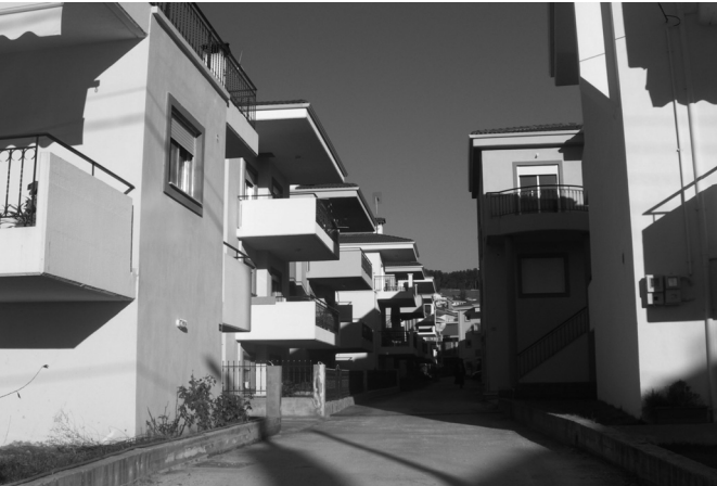
Εικόνα 3: Συγκρότημα με μεζονέτες στις επεκτάσεις των Ιωαννίνων. Η κατασκευή του στηρίζεται στο σύστημα της αντιπαροχής.