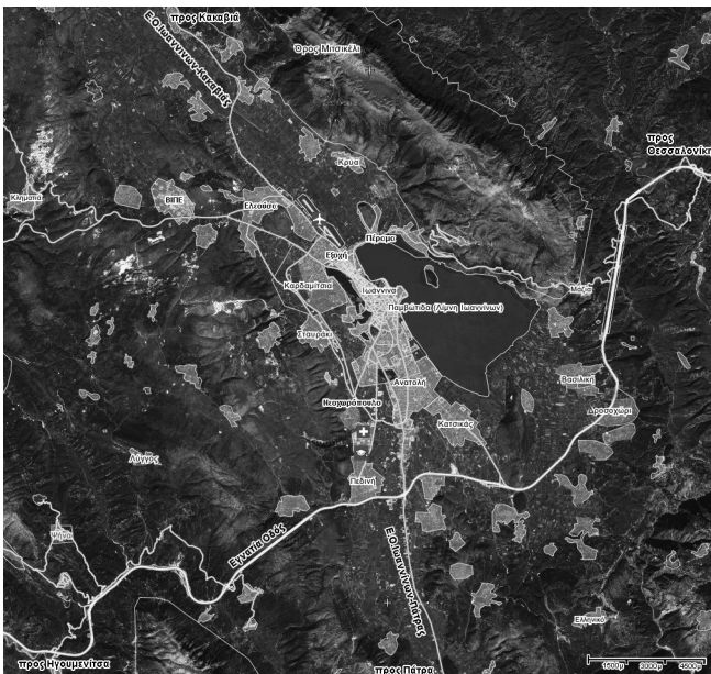
Χάρτης 2: Ευρύτερη περιοχή Ιωαννίνων – οικιστική συγκρότηση και οδικό δίκτυο, 2010 (Υπόβαθρο: Google Earth).

στην ανάπτυξη του μητροπολιτικού χώρου (Χάρτης 2).