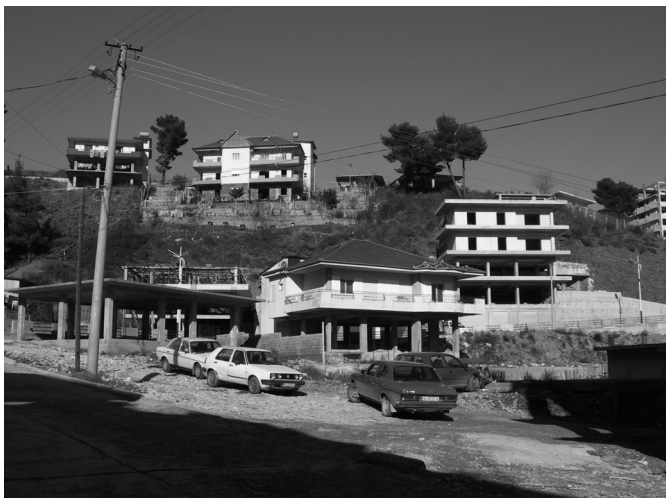
Εικόνα 5: Αυτοστέγαση στο Αργυρόκαστρο. Η κατασκευή των κατοικιών στηρίζεται σε προσωπική εργασία των ιδιοκτητών.