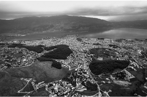
Εικόνα 1: Πανοραμική άποψη των Ιωαννίνων