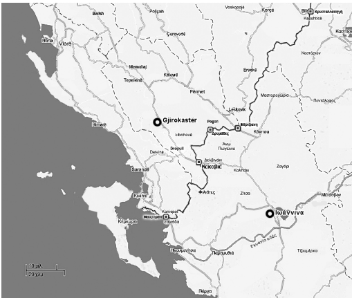
Χάρτης 1: Βορειοδυτική Ελλάδα και Νότια Αλβανία – ελληνοαλβανική μεθόριος, 2010.

σοβαρούς μετασχηματισμούς, καθώς συμπυκνώνουν διαδικασίες ιδιαίτερης σημασίας για το σύγχρονο παγκοσμιοποιημένο περιβάλλον που μάλιστα αλληλεπιδρούν με την καθημερινότητα των τοπικών κοινωνιών. Εκεί συναρθρώνονται σύνθετες ροές, συναντιούνται διαφοροποιημένα περιβάλλοντα, παράγονται νέες κεντρικότητες και πυκνώνουν χωροχρονικές μεταλλαγές.