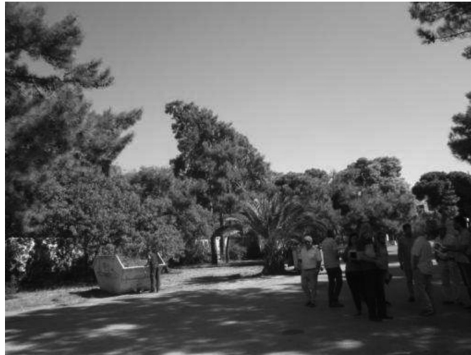
Φωτό 2: Δάσος εντός του Αθλητικού Κέντρου Νεότητας Αγίου Κοσμά

λιβαδικά /21,727 στρ. άλση – πάρκα εντός σχεδίου πόλεως και 10,024 στρ. άλση ή πάρκα εντός ΓΠΣ). Επίσης 601,35 στρ. θεσμοθετημένων και εν μέρει υλοποιημένων χώρων πρασίνου. Όλοι αυτοί οι χώροι καταστρέφονται. Πρόκειται για μια αντιοικολογική βόμβα που θα επιδεινώσει δραματικά το κλίμα της Αττικής.