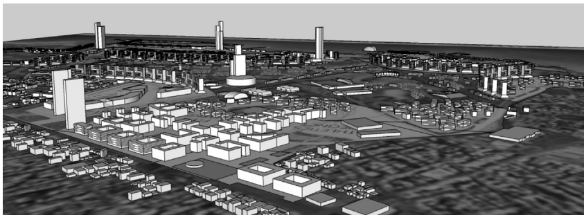
Φωτό 1: Αποψη του Σχεδίου Ολοκληρωμένης Ανάπτυξης

Το ενημερωτικό αυτό σημείωμα στηρίζεται στο πρόσφατο τεχνικό και νομικό υπόμνημα που κατατέθηκαν στις 18/1/2018 στο ΣτΕ. Περιλαμβάνει τις αντιρρήσεις 521 φορέων και προσώπων πάνω στο Π.Δ. για το ΣΟΑ και τη ΣΜΠΕ. Το ΣτΕ σ' αυτή τη φάση διενήργησε με ειδική σύνθεση (πρόεδρος, εισηγητής, επιτροπή) προέλεγχο νομιμότητας του διατάγματος, το οποίο έχει ήδη αποσταλεί στο ΣτΕ για έγκριση.