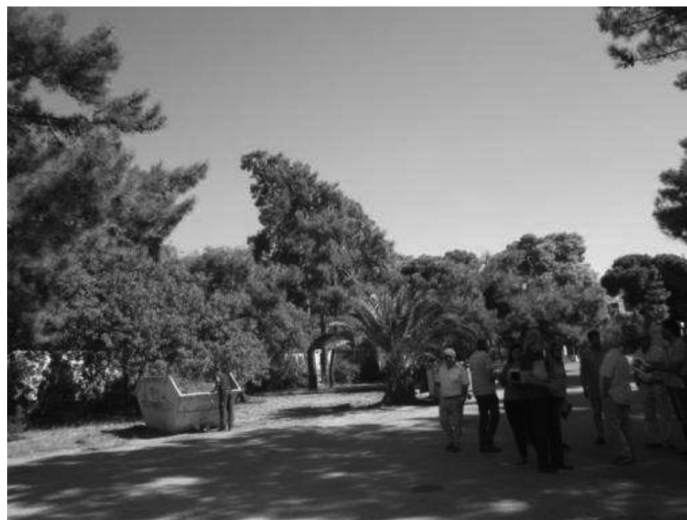
Φωτό 2: Δάσος εντός του Αθλητικού Κέντρου Νεότητας Αγίου Κοσμά

λιβαδικά /21,727 στρ. άλση – πάρκα εντός σχεδίου πόλεως και 10,024 στρ. άλση ή πάρκα εντός ΓΠΣ). Επίσης 601,35 στρ. θεσμοθετημένων και εν μέρει υλοποιημένων χώρων πρασίνου. Όλοι αυτοί οι χώροι καταστρέφονται. Πρόκειται για μια αντιοικολογική βόμβα που θα επιδεινώσει δραματικά το κλίμα της Αττικής.