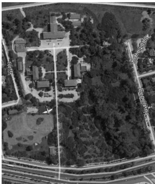
Φωτό 3: Δάσος και ιστορικό κτίριο Κολλεγίου Αθηνών καταστρέφονται

των συμβούλων του ΤΑΙΠΕΔ και δεν κήρυξε ως διατηρητέα σημαντικά νεώτερα μνημεία, όπως το πρώην Κολλέγιο Θηλέων Αθηνών.