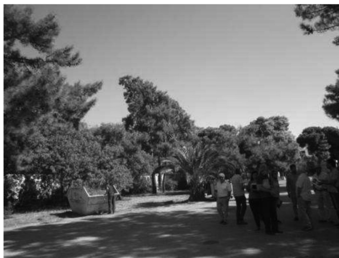
Φωτό 2: Δάσος εντός του Αθλητικού Κέντρου Νεότητας Αγίου Κοσμά

λιβαδικά /21,727 στρ. άλση – πάρκα εντός σχεδίου πόλεως και 10,024 στρ. άλση ή πάρκα εντός ΓΠΣ). Επίσης 601,35 στρ. θεσμοθετημένων και εν μέρει υλοποιημένων χώρων πρασίνου. Όλοι αυτοί οι χώροι καταστρέφονται. Πρόκειται για μια αντιοικολογική βόμβα που θα επιδεινώσει δραματικά το κλίμα της Αττικής.