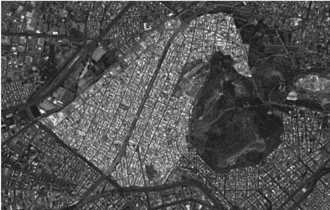
Εικόνα 1: Η γειτονιά των Πετραλώνων, εικόνα αναρτημένη από το google map με ίδια επεξεργασία

θρωποι αυτοί αρχίζουν να κτίζουν τις αυθαίρετες κατοικίες τους και γύρω από τις αυτοσχέδιες παράγκες των προσφύγων της Μικρασιατικής Καταστροφής που, μετά το «Μεγάλο Διωγμό», εγκαθίστανται στα Πετράλωνα, όπως και σε άλλες περιοχές της Αθήνας. Έτσι, μπόρεσαν να καλύψουν αρχικά τις δικές τους ανάγκες για στέγη και να εξασφαλίσουν αργότερα μία στέγη για τα παιδιά τους. Είναι χαρακτηριστική η μαρτυρία της κ. Ελένης: