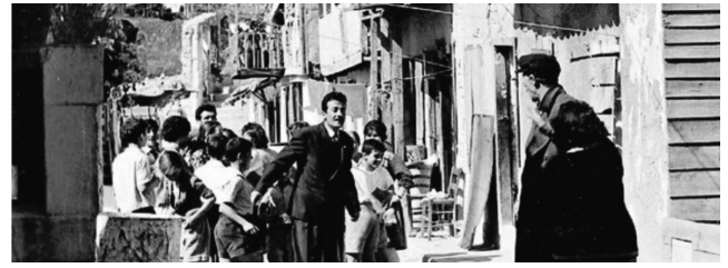
Εικόνα 2: Σκηνή από την ταινία ΣΥΝΟΙΚΙΑ ΤΟ ΟΝΕΙΡΟ

Είναι χαρακτηριστικό πως η ταινία του Αλέκου Αλεξανδράκη με τίτλο ΣΥΝΟΙΚΙΑ ΤΟ ΟΝΕΙΡΟ (1961) είχε λογοκριθεί και πολλά κομμάτια της έλειπαν γιατί, όπως υποστήριζαν οι τότε αρχές “εμφάνιζε ένα εξαθλιωμένο κομμάτι της Ελλάδας” – και μάλιστα σ’ ένα από τα πιο κεντρικά σημεία της Αθήνας, τα Πετράλωνα.