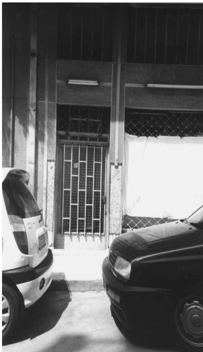
Εικόνα 6: Βιοτεχνία με τσάντες σε ημιυπόγειο χώρο στα άνω Πετράλωνα

σε ευρύτερη γεωγραφική κλίμακα, όπως αυτές που είναι άμεσα συσχετισμένες με την αναδιάρθρωση της παγκόσμιας οικονομίας, την κυριαρχία των νεοφιλελεύθερων πολιτικών και με τις διαδικασίες ανασυγκρότησης του ευρύτερου γεωγραφικού χώρου. Οι αλλαγές αυτές συμβάλλουν, ταυτόχρονα, στην αμφισβήτηση ή την αναπαραγωγή των τοπικών συστημάτων κουλτούρας, και στον επανακαθορισμό ή τη διατήρηση συγκεκριμένων θεσμικών πρακτικών που συνδέονται άμεσα με τη διαδικασία συγκρότησης της πόλης. Στο πλαίσιο αυτής της δυναμικής της διαδικασίας συγκρότησης της πόλης και των γειτονιών της, οι χωροκοινωνικές πρακτικές και τα νοήματα των γυναικών και των ανδρών αλληλοδιαπλέκονται, και αλληλεπιδρούν με ποικίλους χωροκοινωνικούς και χρονικούς ‘καθορισμούς’, που συνδέονται άμεσα με το αστικό περιβάλλον με το οποίο οι γυναίκες, όπως και οι άνδρες, εμπλέκονται στις καθημερινές τους ρουτίνες. Είναι ρουτίνες διαμορφωμένες από τις δυνατότητες πρόσβασης στη ζωή της γειτονιάς και της πόλης, και έντονα διαφοροποιημένες κατά φύλο, όχι μόνο στο επίπεδο της οργάνωσης του χώρου ή του καταμερισμού εργασίας, αλλά και στο επίπεδο των συμβολικών σημασιών και μηνυμάτων που μεταφέρει ο χώρος (Wilson 1991).