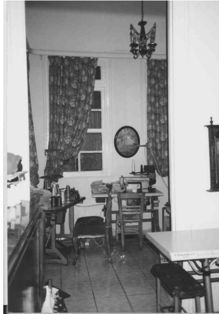
Εικόνα 5: Ζωή και δουλειά με το κομμάτι στα Πετράλωνα. Χώρος αμειβόμενης εργασίας σε (νεοκλασικό) σπίτι του Θησείου

όπου θα μπορούσαν να εκμεταλλευτούν, ταυτόχρονα, την εγγύτητα και το ακόμη φτηνότερο γυναικείο εργατικό δυναμικό (Λαμπριανίδης, 1996) 10 . Όμοια, δεν είναι τυχαίο ότι τα εργοστάσια και οι μικρές βιοτεχνίες της περιοχής που άντεξαν για καιρό στους κλυδωνισμούς της παγκόσμιας οικονομίας απασχολούσαν κυ-