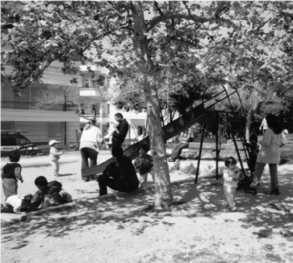
Εικόνα 4: Μανάδες με τα παιδιά τους στο πάρκο που έχουν διεκδικήσει.

στο πάρκο την ημέρα των εκσκαφών για να κτιστεί το κτήριο του παρκινγκ. Είπαμε στους εργάτες ότι δεν θα φύγουμε από κει αν δεν μας υποσχεθεί κανείς από την κυβέρνηση ή από το δήμο ότι αυτά τα σχέδια θα ακυρωθούν” (Παναγιώτα, 55 ετών την περίοδο της συνέντευξης).