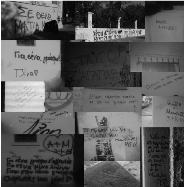
Εικόνα 1 «Κολλάζ από συνθήματα σε διάφορα σημεία της πόλης»

με τα γύρω σπίτια να δημιουργούν έναν μικρό περικλειστο χώρο με χαμηλό φωτισμό, δημιουργώντας κατάλληλες προϋποθέσεις για νυχτερινές συναντήσεις. Αυτό είναι ένα απλό παράδειγμα, καθώς λόγω της σύ-