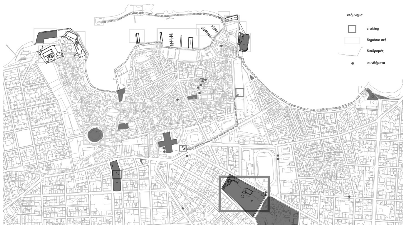
Εικόνα 2 «Χαρτογράφηση του αστικού ερωτισμού στα Χανι