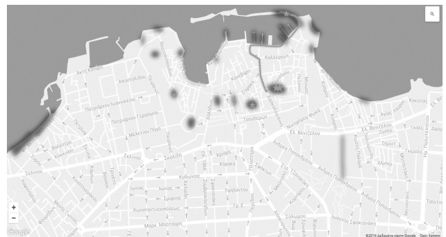
Εικόνα 4 5 «Ανακαλύπτοντας μια άλλη ταυτότητα»

δυτικότερο όριο την οδό Δασκαλογιάννη. Ουσιαστικά πραγματοποιείται στα στενά της Σπλάτζιας μέχρι την πλατεία. Από την πλατεία κατευθυνόμαστε βόρεια προς τις προβλήτες του λιμανιού, όπου εκεί παρουσιάζονται δύο επιλογές: ο Φάρος και η παραλία στην αρχή της διαδρομής και η Πύλη της Άμμου με την παιδική χαρά στη συμβολή Καλλέργων και ακτής Μιαούλη (Κουμ Καπί). Άλλα σημεία ενδιαφέροντος είναι ο πεζόδρομος της Κοραή, ο Δυτικός Προμαχώνας, το Χέρι, το Κάστρο του Φιρκά, το Κουμ Καπί για τα παγκάκια και την παραλία του και η οδός Ποτιέ.