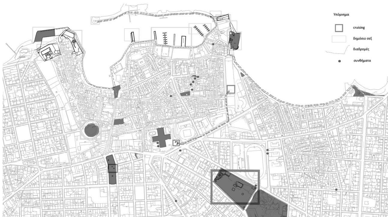
Εικόνα 2 «Χαρτογράφηση του αστικού ερωτισμού στα Χανιά»