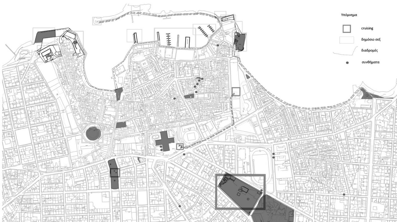
Εικόνα 2 «Χαρτογράφηση του αστικού ερωτισμού στα Χανι