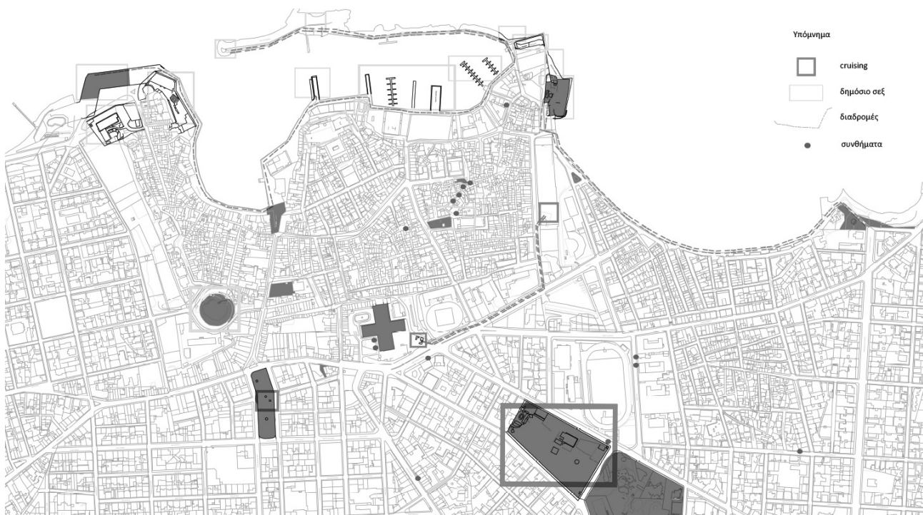
Εικόνα 2 «Χαρτογράφηση του αστικού ερωτισμού στα Χανιά»