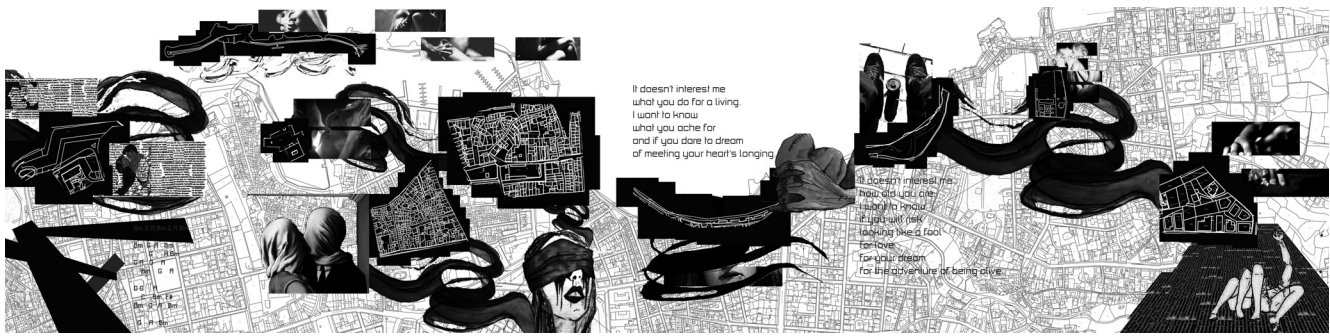
Εικόνα 3 «Ερωτική περιπλάνηση»

ραλιακά στην Βίλα Κούνδουρου και το πάρκο, μέρος για στάση ή πέρασμα προς το Κουμ Καπί. Το τελευταίο για την Β. είναι το μέρος όπου “χτίζεται” ο ερωτισμός με κουβέντα, περπάτημα και ενδεχομένως στάσεις στα παγκάκια ή την παραλία. Όπως φαίνεται και στον χάρτη, η ένταση κλιμακώνεται όσο πλησιάζουμε στο κέντρο από την ανατολική πλευρά της πόλης, σταματώντας στην Πύλη της Άμμου. Περιδιαβαίνουμε τα στενά της Σπλάτζιας με τελικό προορισμό την πλατεία και την οδό Ποτιέ. Τα τελευταία επισημάνθηκαν καθώς υπάρχουν πολλά μπαρ, αναπόσπαστο κομμάτι της κοινωνικοποίησης και ευνοϊκός τόπος αναζήτησης ερωτικού συντρόφου. Η περιπλάνηση παίρνει τον ίδιο δρόμο προς τα πίσω, με το Κουμ Καπί να παίζει πάλι τον ρόλο του ενδιαμέσου σταδίου, όπου το αντικείμενο του ενδιαφέροντος έχει βρεθεί και ο ερωτισμός χρειάζεται την απαραίτητη συντήρηση. Άλλο ενδιαφέρον σημείο είναι ο Φάρος, σαν προορισμός για ερωτικές περιπτώσεις και σαν διαδρομή μέχρι εκεί. Στα ίδια πλαίσια εντάσσεται και το Χέρι, στα δυτικά, όντας απομονωμένο και ήσυχο μέρος, όπως και η αυλή της Ρόζα Νέρα.