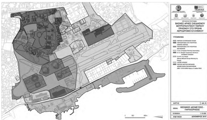
Εικ. 4: Πρόταση ΕΜΠ της ομάδας «Μπελαβίλα» (2010) Θεσμικές Δεσμεύσεις – Παραχωρήσεις (υφιστάμενη κατάσταση). Το ΕΑΚΝ Αγίου Κοσμά: νοτιοδυτικά, ΥΠΑ, Ολυμπιακές εγκαταστάσεις: v/a και δυτικά, Υπουργείο Μεταφορών: β/δ, Υπουργείο Εθνικής Άμυνας.:β/δ, Ε.Τ.Α.: αν.αερολιμένας.

την ανάπτυξή του στις οποίες προβλεπόταν ως κατεύθυνση η οικιστική και επιχειρηματική ανάπτυξη και όχι η αμιγής διατήρηση του ανοικτού χώρου για την απόδοσή του σε δημόσια χρήση, οι όμοροι Δήμοι (της ευρύτερης περιοχής Αλίμου, Αργυρούπολης, Γλυφάδας