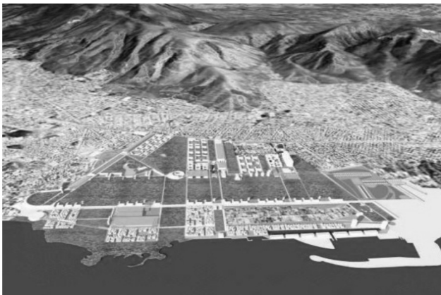
Εικ.9: Τρισδιάστατη απεικόνιση της μελέτης του Ισπανού αρχιτέκτονα José Antonio Acebillo (2011) για το Ελληνικό, «Barcelona Strategic Urban System» (BcnSuS).

Τον Σεπτέμβριο του 2010, μόλις τέσσερις μήνες μετά την υπογραφή του αρχικού μνημονίου, ο πρωθυπουργός Γ. Παπανδρέου υπογράφει ένα μνημόνιο συνεργασίας με το Κατάρ 9 για την «αξιοποίηση του Ελληνικού». Ήδη από το 2009 ο τότε πρωθυπουργός είχε ζητήσει από τον καταλανό αρχιτέκτονα José Antonio Acebillo να πάρει μέρος στον σχεδιασμό της περιοχής. Σύμφωνα με τον αρχιτέκτονα, δεν αρκούσε ένα πάρκο πρασίνου στο Ελληνικό, αλλά χρειαζόταν η δημιουργία ενός σχεδίου γενικού πλάνου βασικής χωροθέτησης λειτουργιών: «conceptual–strategic Urban Model» (Pollalis 2011-2012). 10 Με τίτλο «New Urban Centrality for Innovation» ενισχύει τη λογική της ανάπτυξης που θέλει να προκαλέσει το ενδιαφέρον ιδιωτών επενδυτών με κατεδάφιση του μεγαλύτερου μέρους των υφιστάμενων εγκαταστάσεων και κτιρίων και αντικα-