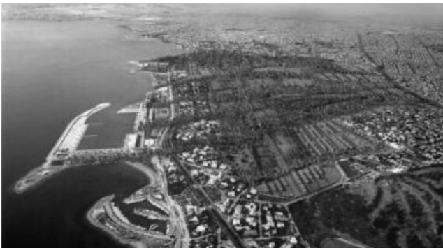
Εικ. 3: Διεθνής Αρχιτεκτονικός Διαγωνισμός Ιδεών: Ανάπτυξη και σχεδιασμός του χώρου του πρώην αεροδρομίου του Ελληνικού (2003). Τρισδιάστατη απεικόνιση του 1ου βραβείου. Μελετητές: DZO Architecture (Elena Fernandez – David Serero, New York, Arnaud Descombes – Antoine Regnault, Paris, Philippe Coignet (Landscape Architect), Ryosuke Shimoda και Erwin Redl (Artist). Οργάνωση: ΥΠΕΧΩΔΕ – Οργανισμός Ρυθμιστικού Σχεδίου και Προστασίας Περιβάλλοντος Αθήνας – Union Internationale des Architectes (UIA).

Πρόκειται για άνευ νόμιμης άδειας και εκ του προχείρου κατασκευασμένες δαπανηρές εγκαταστάσεις, ευτελείς και ενεργοβόρες, με υψηλό κόστος στη λειτουργία και στη συντήρησή τους, χωρίς καμία πρόβλεψη για φυσικό φωτισμό και αερισμό των κλειστών χώρων, με σοβαρότατες ελλείψεις σε ηλεκτρομηχανολογικό εξοπλισμό και κυρίως στα στοιχειώδη προβλεπόμενα μέτρα που ορίζει ο Κανονισμός Πυροπροστασίας (όπως διαπιστώθηκε κατά τον έλεγχο τους από την αρμόδια επιτροπή –προ της αδειοδότησης λειτουργίας τους– το 2015).