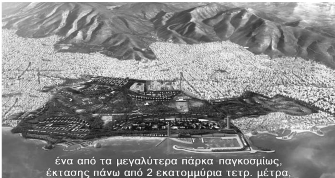
Εικ.11: Τρισδιάστατη απεικόνιση της μελέτης για το Ελληνικό από το γραφείο του Βρετανού αρχιτέκτονα Sir Norman Foster για λογαριασμό της Εταιρείας «Lamda Development» (2014). Διακρίνονται ζώνες οικιστικής ανάπτυξης, κάποιες προτεινόμενες αθλητικές εγκαταστάσεις, απόρροια της μελέτης «Πολλάλη» στο κέντρο της ζώνης πρασίνου (πρώην «Πράσινος Αστερίας» της μελέτης «Πολλάλη»), το μητροπολιτικό πάρκο (μεγαλύτερης έκτασης από τη μελέτη ΣΟΑ/ΣΜΠΕ,2017) και μόνο δύο εκ των κτιρίων «τοπόσημα-ουρανοξύστες» της παρούσας προς έγκριση μελέτης.

Σε ό,τι αφορά τη σημαντικότητα του πολεοδομικού σχεδιασμού σε κρατικό επίπεδο, χαρακτηριστικό και ενδεικτικό της απόλυτης εκμηδένισης της σημασίας της πολεοδομίας και του αστικού σχεδιασμού αποτελεί το γεγονός ότι τα σχέδια της μελέτης Foster (2014) δεν δημοσιοποιήθηκαν τότε. Αντ' αυτού δόθηκε στη δημοσιότητα ένα βίντεο εικονικής πραγματικότητας (εικ. 11) μέσα στο οποίο παρουσιαζόταν το σχέδιο γενικής διάταξης σε τρισδιάστατη μορφή, καθώς και