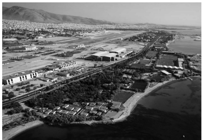
Εικ. 2: Άποψη του ΕΑΚΝ Αγίου Κοσμά. Στο βάθος διακρίνονται τα Εθνικά Κλειστά Προπονητήρια των Εθνικών Ομοσπονδιών (2002).