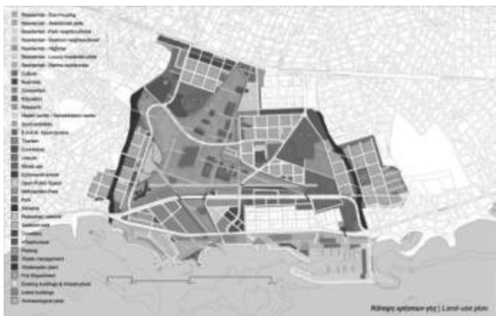
Εικ.10: Κάτοψη χρήσεων γης (land-use plan) της μελέτης «Hellinikon – Spyros Pollalis». Διακρίνεται η ζώνη πρασίνου σε σχήμα αστεριού (εξού και το όνομα της μελέτης «Πράσινος Αστερίας»), οι ζώνες οικιστικής ανάπτυξης (πέντε συνολικά), του εμπορίου και αναψυχής (παραλιακό μέτωπο, Λεωφόρος Βουλιαγμένης και κεντρικός άξονας διαμόρφωσης παράλληλα προς Λεωφόρο Ποσειδώνος), εκπαίδευσης/έρευνας και πολιτισμού (κεντρικά και β/α) και τέλος το ΕΑΚΝ Αγίου Κοσμά στο κέντρο του «Αστερία».

Α.Ε.» το εν λόγω σχέδιο στρατηγικής ανάπτυξης για τον χώρο. Ακολούθως (1.7.2011) ψηφίζεται από τη βουλή ο Ν. 3986/Α'/ΦΕΚ 152/2011 «Επείγοντα Μέτρα Εφαρμογής Μεσοπρόθεσμου Πλαισίου Δημοσιονομικής Στρατηγικής 2012-2015» και εκ παραλλήλου συστήνεται το ΤΑΙΠΕΔ Α.Ε. για την αξιοποίηση περιουσιακών στοιχείων, για την «πολεοδομική ωρίμανση και επενδυτική ταυτότητα» των δημοσίων ακινήτων και για την αξιοποίησή τους από μελλοντικούς ιδιώτες επενδυτές. Κατά παρέκκλιση της μέχρι τότε ισχύουσας νομοθεσίας για τις ζώνες αξιοποίησης, μέσα στις οποίες ανήκει και η περιοχή του Ελληνικού και του Αγίου Κοσμά, θεσμοθετούνται νέοι όροι δόμησης, ακόμη και στην παραλιακή ζώνη, εμφανώς αμβλυμένοι περιορισμοί αυτών και επίσης διευρύνονται οι πιθανές χρήσεις και οι δυνατότητες ανάπτυξης. Βρισκό-