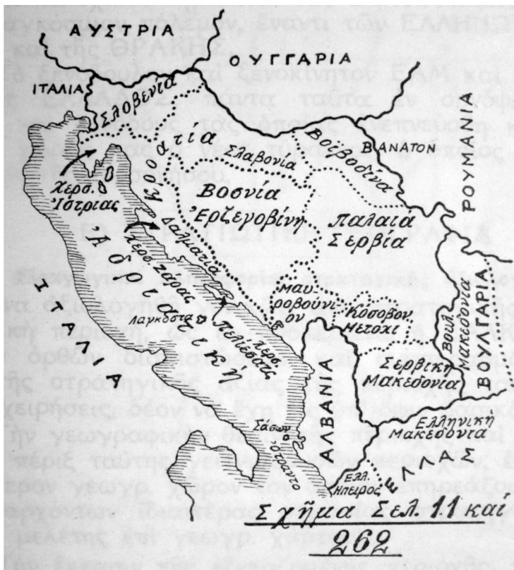
Εικ. 1: Χάρτης της Σχολής Ευελπίδων, 1962.