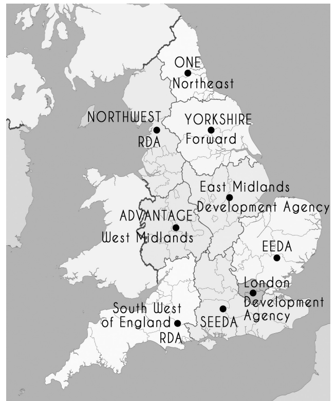
Εικόνα 1: Οι εννιά «Regional Development Agencies» της Αγγλίας που καταργήθηκαν το 2010.

Οι πολιτικές λιτότητας και περικοπής των δημόσιων δαπανών είναι η πρώτη βασική πλευρά και οι πολιτικές «λιγότερου κράτους» η δεύτερη. Το «λιγότερο κράτος» αποτυπώθηκε στην κατάργηση πολλών οργανισμών και περιορισμό του «τρίτου τομέα» που χαρακτηρίστηκε και ως «bonfire of the quangos» (Curtis 2010). Αυτή η επιλογή ήρθε ουσιαστικά να καταργήσει το πλέγμα δομών και διακυβέρνησης που είχε δημιουργήσει η προηγούμενη περίοδος του «New Labour». Χαρακτηριστικό παράδειγμα σε σχέση με τα ζητήματα που εξετάζουμε εδώ αποτελεί η κατάργηση των RDA, των οργανισμών σε περιφερειακό επίπεδο, οι οποίες απορροφούσαν και πολύ μεγάλα κονδύλια.