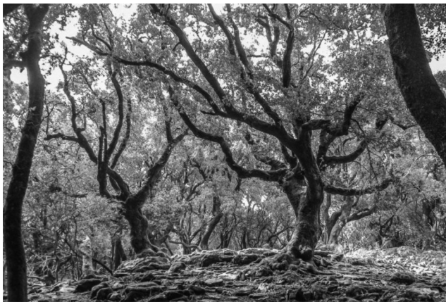
Εικόνα 2: Το δάσος από κοντά

Το καθεστώς της κοινοτικής ιδιοκτησίας του δάσους συνέβαλε στην ασφάλεια της επιβίωσης, στην ισότιμη πρόσβαση και αποφυγή συγκρούσεων, καθώς υπήρχαν συγκεκριμένοι κανόνες συμπεριφοράς με κυρίαρχο κανόνα «όποιος ανήκει στην κοινότητα μπορεί να χρησιμοποιεί τον πόρο». Η συμμετοχή σε ομάδες εργασίας συγκροτούσε και δομούσε τους κοινωνικούς ρόλους και τις υποχρεώσεις του ατόμου απέναντι στη