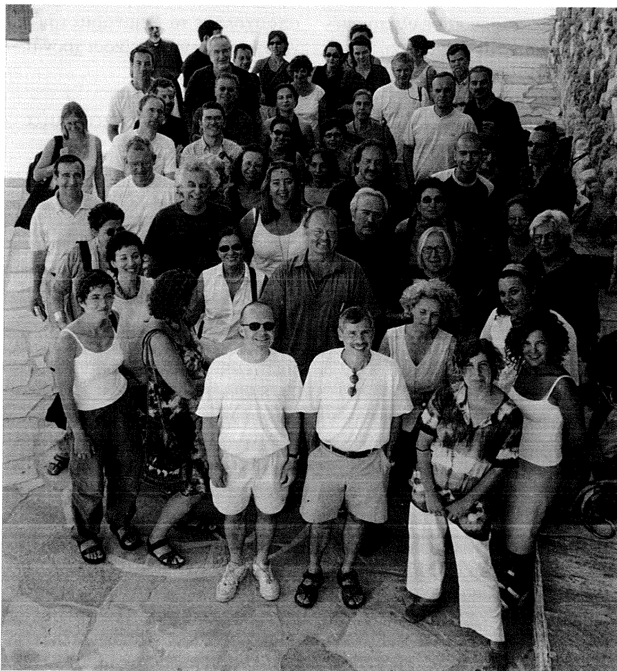
Οι συμμετέχοντες στο Σεμινάριο του Αιγαίου, Νάξος, Σεπτέμβριος 2003

Ελπίζουμε πως η οργανωτική επιτροπή θα βρει το κουράγιο να το κάνει. Εμείς πάλι, όντας αισιόδοξοι και αισιόδοξες από φύση και θέση, θα διατηρήσουμε την πεποίθηση ότι το Σεμινάριο της Νάξου μπορεί να αποτελέσει την αφετηρία ενός καινούργιου κύκλου, που θα δώσει την ευκαιρία σε ένα διευρυμένο και νεότερο ίσως κοινό να συνεχίσει την παράδοση και να ξαναπαιάσει τα νήματα των συζητήσεων που έμειναν στη μέση.