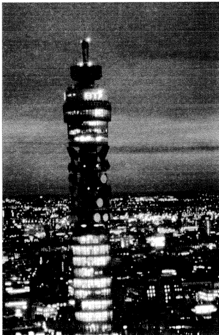
Το Λονδίνο βρίσκεται σε πλεονεκτική θέση στα δίκτυα τηλεπικοινωνιών. Στην εικόνα ο πύργος της ΒΤ

Δεν είναι δυνατό να αναγνωριστούν συνολικά κοινά κριτήρια χωροθέτησης για όλες τις επιχειρήσεις παροχής υπηρεσιών προς παραγωγούς, καθώς η φύση τους διαφέρει κυρίως ως προς την ανάγκη άμεσης επαφής με την αγορά. Όπως προκύπτει από σχετικές μελέτες (Coffey & Bailly 1996, Daniels 1995, Moulaert & Gallouj 1995, Cavola & Martinelli 1995), οι υπηρεσίες προς παραγωγούς συγκεντρώνονται κυρίως σε παραδοσιακά βιομηχανικά κέντρα ή σε πόλεις που παρουσιάζουν σημαντική οικονομική δραστηριότητα και αποτελούν κέντρα διοίκησης. Κατά τον Daniels (1995: 135), η ανάπτυξη του κλάδου σε περιφερειακά κέντρα του Ηνωμένου Βασιλείου σχετίζεται άμεσα με τη δυνατότητα επικοινωνίας τους με το Λονδίνο. Ο ίδιος αποδίδει το φαινόμενο σε δύο λόγους: τη συνολική οικονομική δραστηριότητα της περιοχής, όπου στεγάζονται γραφεία κεντρικής διοίκησης επιχειρήσεων σημαντικών σε παγκόσμιο επίπεδο, και την πλεονεκτική θέση της περιοχής στα δίκτυα τηλεπικοινωνιών και μεταφορών που εξασφαλίζουν πρόσβαση σε πηγές πληροφοριών και σε αγορές εκτός χώρας.