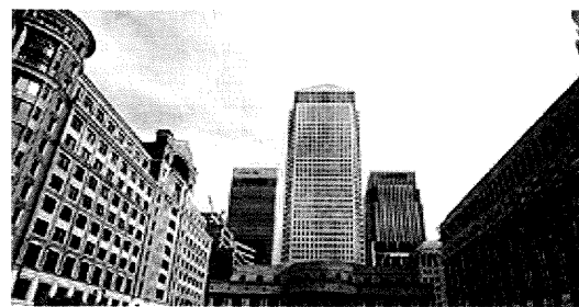
Κτήρια γραφείων στην ευρύτερη περιοχή του Λονδίνου

Το φαινόμενο επιβεβαιώνεται από εμπειρικά στοιχεία σχετικών ερευνών για τα αστικά δίκτυα Γαλλίας, Ηνωμένου Βασιλείου και Ιταλίας. Στο Ηνωμένο Βασίλειο η αποκέντρωση των υπηρεσιών προς παραγωγούς κατευθύνεται σε σημαντικά αστικά κέντρα κυρίως στα ΝΑ της χώρας, αλλά και σε μικρότερες πόλεις οι οποίες δεν διαθέτουν τις οικονομίες κλίμακας που κατά κανόνα έλκουν τις δραστηριότητες αυτές (Daniels 1995). Στη Γαλλία δυναμική ανάπτυξη του τομέα παρατηρείται σε πρωτεύουσες περιφερειών. Η Λιλ (959.433 κάτ.) παρουσιάζει εξειδίκευση σε υπηρεσίες διαχείρισης και πληροφορικής, ενώ το Μπορ-