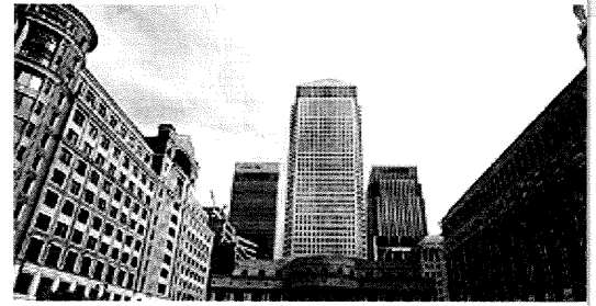
Κτήρια γραφείων στην ευρύτερη περιοχή του Λονδίνου

Το φαινόμενο επιβεβαιώνεται από εμπειρικά στοιχεία σχετικών ερευνών για τα αστικά δίκτυα Γαλλίας, Ηνωμένου Βασιλείου και Ιταλίας. Στο Ηνωμένο Βασίλειο η αποκέντρωση των υπηρεσιών προς παραγωγούς κατευθύνεται σε σημαντικά αστικά κέντρα κυρίως στα ΝΑ της χώρας, αλλά και σε μικρότερες πόλεις οι οποίες δεν διαθέτουν τις οικονομίες κλίμακας που κατά κανόνα έλκουν τις δραστηριότητες αυτές (Daniels 1995). Στη Γαλλία δυναμική ανάπτυξη του τομέα παρατηρείται σε πρωτεύουσες περιφερειών. Η Λιλ (959.433 κάτ.) παρουσιάζει εξειδίκευση σε υπηρεσίες διαχείρισης και πληροφορικής, ενώ το Μπορ-