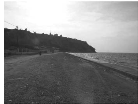
Εικόνα 11. Τεχνητή ακτογραμμή προς αντιμετώπιση της έντονης διάβρωσης: (α) Τα απρόσμενα κρηπιδώματα στις εκβολές του Γαλλικού (Κατηγ. Α) και (β) στο ακρωτήριο του Μεγάλου Εμβόλου (Κατηγ. Γ)

του Θερμαϊκού Κόλπου ως στοιχείου που καθορίζει τη ζωή της πόλης και τη βιωσιμότητά της είναι η Στρατηγική για την Αστική Ανθεκτικότητα «Θεσσαλονίκη 2030» (ΔΘ 2017). Αυτή θέτει «εκ των άνω» το όραμα για την πόλη, τη βιώσιμη ανάπτυξη και προτείνει λύσεις σε ζητήματα τοπικής και μητροπολιτικής εμβέλειας επιχειρώντας να συγκεράσει τις μακροπρόθεσμες διεθνείς διακηρύξεις και ευρωπαϊκές στρατηγικές με τους τοπικούς και περιφερειακούς στόχους ανάπτυξης. Ο επαναπροσδιορισμός της σχέσης της πόλης με τη θάλασσα αποτελεί έναν από τους τέσσερις βασικούς πυλώνες-στόχους. Ειδικότερες επιδιώξεις είναι η ολοκληρωμένη οικονομική και αστική ανάπτυξη του Θερμαϊκού Κόλπου, η αποκατάσταση του θαλάσσιου οικοσυστήματος και παρακολούθηση της περιβαλλοντικής ανθεκτικότητας του Θερμαϊκού Κόλπου, η ενίσχυση της πολιτιστικής και κοινωνικής του ταυτότητας με νέες δραστηριότητες και υποδομές, καθώς και ένα αποτελεσματικό σύστημα διακυβέρνησης, που θα περιλαμβάνει ενίσχυση των δράσεων της Κοινωνίας των Πολιτών, και την ανάπτυξη της συνεργασίας μεταξύ των εμπλεκόμενων φορέων κατά τη διαδικασία λήψης αποφάσεων.