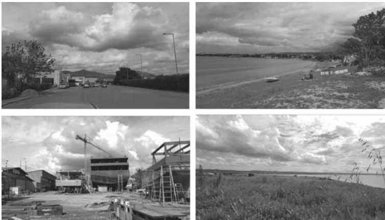
Εικόνα 6. Ποικίλα τοπία περιοχών αστικής διάχυσης (Κατηγορ. Γ): Παραλία Πυλαίας

και στις πιο προβεβλημένες περιοχές, όπως στην «Παλιά» και τη «Νέα Παραλία» στο δήμο Θεσσαλονίκης (βλ. Εικόνα 8).