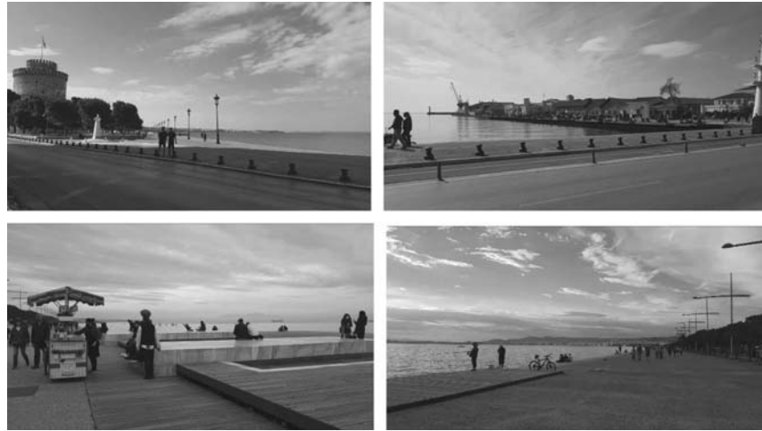
Εικόνα 8. (α, β) Η «Παλιά» και (γ, δ) η «Νέα Παραλία» (Κατηγ. Β)

Η περιοχή μελέτης είναι μια «τυπική» παράκτια περιοχή της Μεσογείου μητροπολιτικής συγκέντρωσης πληθυσμού στην οποία αστικοποιημένες εκτάσεις εναλλάσσονται με υγροτοπικά συστήματα, παραγωγική γη και τόπους πολιτιστικής κληρονομιάς. Οι συνέχεις πιέσεις παρακτιοποίησης και οι προκλήσεις που αντιμετωπίζουν τα μητροπολιτικά παράκτια τοπία θέτουν στο προσκήνιο την επαναδιαπραγμάτευση της σχέσης της πόλης με το θαλάσσιο χώρο ως πόρο βιώσιμης και ανθεκτικής ανάπτυξης, αλλά και ως στοιχείο συλλογικής πολιτιστικής ταυτότητας. Η δεκαετία της κρίσης έχει οδηγήσει σε μία τάση σταθεροποίησης της κατάστασης παρακτιοποίησης, δεδομένης της περιορισμένης πίεσης για νέα δόμηση και νέες δραστηριότητες. Η εμπειρική εικόνα δείχνει επίσης την αποσπασματικότητα των