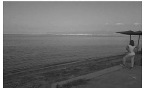
Εικόνα 7. Απόψεις από τη θάλασσα και εσωτερικές οπτικές προς την απέναντι ακτή: (α, β) Ιστορικό κέντρο, (γ) παραλία Καλαμαριάς, (δ) παραλία Περαιάς. Ξεχωρίζει το δομημένο σύμπλεγμα και οι κορυφογραμμές του στο περίγραμμα του ευρύτερου τοπίου

γεωμορφολογικό και τεχνητό όριο (βλ. Εικόνα 10). Αντίστροφα, από το επίπεδο των ακτών προβάλλει το ευρύτερο γεωμορφολογικό πεδίο των απέναντι ορεινών όγκων (Όλυπος, Κίσαβος, Πιέρια κ.λπ.), των οικιστικών περιοχών και των κορυφογραμμών του αστικού τοπίου διαμέσου των κενών δόμησης. Δεν έχει γίνει ωστόσο καμία ολοκληρωμένη μελέτη θέασης.