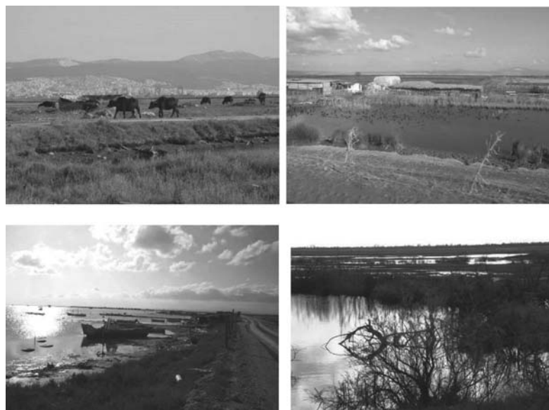
Εικόνα 4. Εθνικό Πάρκο Γαλλικού-Λουδία-Αλιάκμονα – Αντιπροσωπευτικά τοπία φυσικών και αγροτικών περιοχών υψηλής περιβαλλοντικής αξίας (Κατηγ. Α): (α) Εκβολές Γαλλικού, (β) υδροτοπική ζώνη αναχώματος Αξιού, (γ) θέση ψαράδων Αγ. Νικόλαος, (δ) εκβολές Αξιού

Οι Γεμενετζή και Χριστοδούλου (2012), όπως και οι Δούμας κ.ά. (2017), αναγνωρίζουν ποικιλία τοπίων στον Κόλπο στο κεντρικό τμήμα της ακτογραμμής της περιοχής μελέτης, όπου εντοπίζονται οι πλέον τεκμηριωμένες διακριτές ενότητες, με αναγνωρίσιμα σημεία συλλογικής αναφοράς (Χαστάογλου 2012, 2015· Αθανασίου 2015· Βυζοβίτη 2015). Προηγούμενες φάσεις αστικοποίησης επιβιώνουν ως παραγνωρισμένα βιωμένα