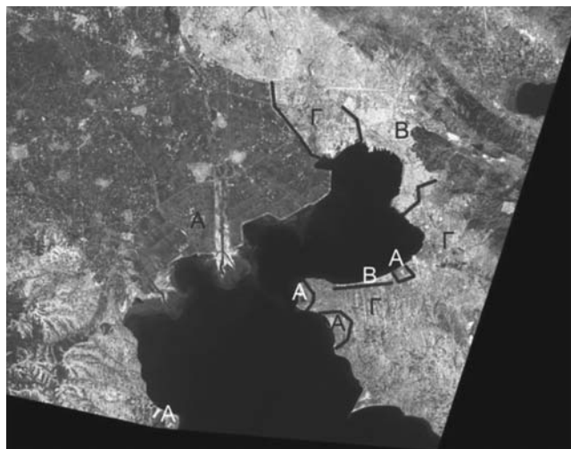
Εικόνα 3. Ευρείες χωρικές ενότητες (Α, Β, Γ) διαφοροποιημένης κατάστασης παρακτιοποίησης (πηγή: Δορυφορική εικόνα 2000, Πολεοδομικό Αρχείο Θεσσαλονίκης, ΑΠΘ και ίδια επεξεργασία)