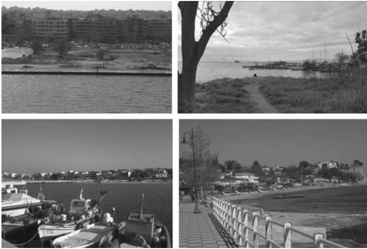
Εικόνα 5. Αντιπροσωπευτικά τοπία συνεκτικά δομημένων αστικών περιοχών και των «κενών» τους (Κατηγορ. Β): (α, β) Θεσσαλονίκη-Κελλάριος όρμος, (γ) Παραλία Ν. Επιβατών, (δ) Μακρύγιαλος