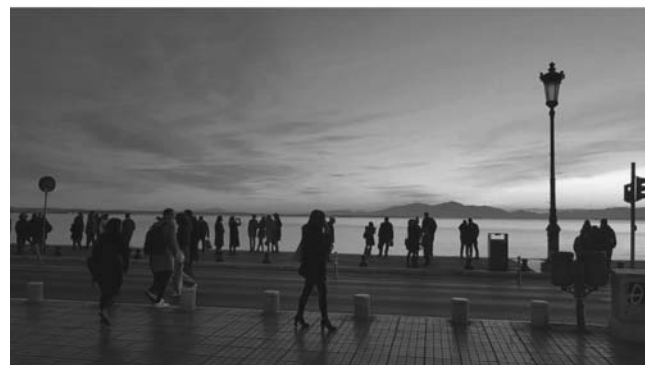
Εικόνα 9. Το μεταβαλλόμενο τοπίο της θάλασσας και των απέναντι ακτών (Ολυμπος) μαγνητίζουν το βλέμμα

εφαρμοζόμενων υλικών παρεμβάσεων (άτυπων και σχεδιασμένων) αλλά και των χωρικών ρυθμίσεων (βλ. 3.2, Εικόνα11).