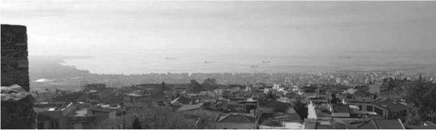
Εικόνα 10. Χαρακτηριστική άποψη του τοπίου του Κόλπου από το Επταπύργιο

τις αστικές εγκαταστάσεις και δραστηριότητες είναι ιδιαίτερα σύνθετο ζήτημα. Ο ρόλος της διακυβέρνησης στην κατεύθυνση της εναρμονισμένης διασύνδεσης των επιπέδων σχεδιασμού για τοπικά ενήμερες αλλαγές είναι κομβικός (MacKenzie 2020).