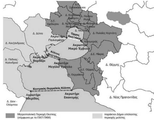
Εικόνα 1. Η παράκτια περιοχή μελέτης στον εσωτερικό Θερμαϊκό Κόλπο

Ακολουθώντας τις σύγχρονες προσεγγίσεις και μεθοδολογίες χαρακτηρισμού του τοπίου, και ειδικότερα του παράκτιου (βλ. 2.1, 2.2), η διερεύνηση υιοθέτησε