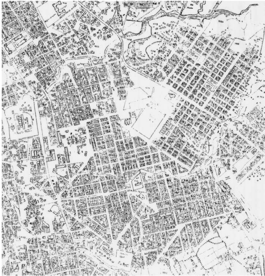
Εικόνα 4: Άνω και Κάτω Τούμπα, φωτογραμμετρικό διάγραμμα 1962

Από το δείγμα των καταγραφών του Προσφυγικού Μητρώου που εξετάστηκε προέκυψαν 36 θέσεις προσωρινής εγκατάστασης, 14 υφιστάμενα κτίρια και 22 συνοικισμοί, οι οποίοι εντοπίστηκαν σε χάρτη, και αποτυπώθηκαν με σημειώτικό τρόπο όσον αφορά τα κτίρια και αναλογικά με το πλήθος των οικογενειών όσον αφορά τους συνοικισμούς. Ο χάρτης συνοδευόταν από αναλυτικό υπόμνημα με τις αντίστοιχες αναφερόμενες ονομασίες τους και το πλήθος των οικογενειών σε κάθε θέση, καθώς και από φωτογραφικό αρχειακό υλικό που απεικόνιζε τα είδη και τη μορφή των προσωρινών καταλυμάτων και τις συνθήκες διαβίωσης σε αυτά. Αξίζει να σημειωθεί ότι οι περισσότεροι από τους συνοικισμούς