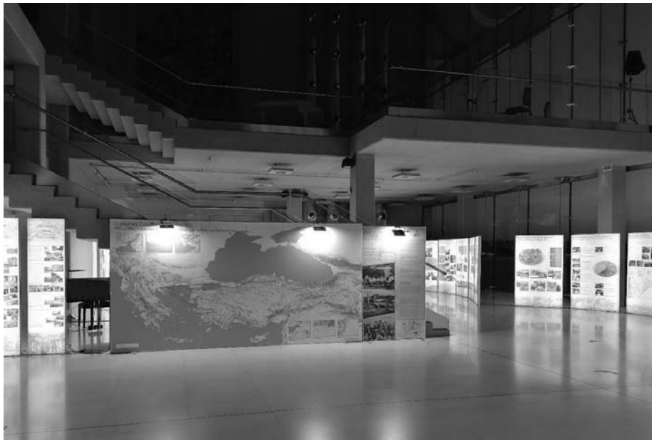
Εικόνα 1: Άποψη της έκθεσης