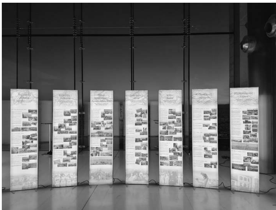
Εικόνα 2: Αποψη της έκθεσης

Η συγκρότηση, οργάνωση και γραφιστική επεξεργασία του εκθεσιακού υλικού έγινε με γνώμονα να είναι εύληπτα και ελκυστικά για το κοινό όλων των ηλικιών τα συμπεράσματα από τη μελέτη και επεξεργασία του πλούτου των πληροφοριών που συγκεντρώθηκαν, με μια διαβαθμισμένη εμβάθυνση στα διάφορα πεδία, το ιστορικό, το πολιτικό, το κοινωνικό, το οικονομικό, καθώς και στον τρόπο που επηρεάστηκε η ιστορία και η εξέλιξη της πόλης. Ο σχεδιασμός της έκθεσης ενείχε επίσης ιδιαίτερες προκλήσεις, καθώς ο προϋπολογισμός ήταν περιορισμένος και ο χώρος προκαθορισμένος, αυτός του 'απαιτητικού' αλλά εντυπωσιακού φουαγιέ του νεότερου κτιρίου του Μεγάρου Μουσικής Θεσσαλονίκης (κτίριο Μ2). Η έκθεση αποτελούνταν από