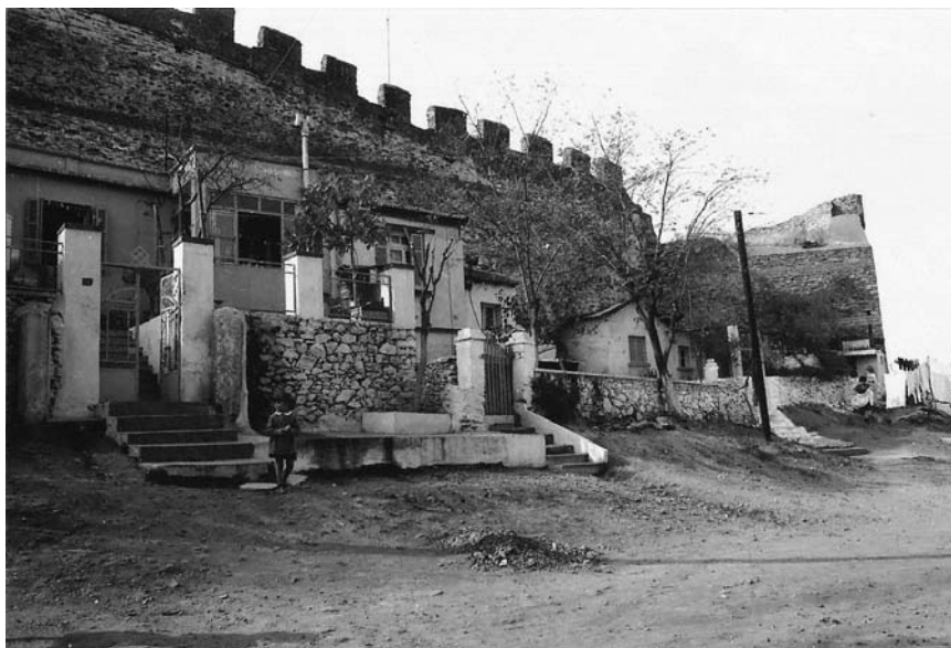
Εικόνα 5: Προσφυγικές κατοικίες κατά μήκος και σε επαφή με τα τείχη στην Άνω Πόλη © Μιχάλης Νομικός, τέλη δεκαετίας 1960

(2,1%). Επρόκειτο δηλαδή για ένα νέο κατά κύριο λόγο και εξειδικευμένο εργατικό δυναμικό, ταλαιπωρημένο βέβαια από τις κακουχίες, το οποίο κατέφθασε σε μια πόλη επίσης ταλαιπωρημένη και μισοκατεστραμμένη που πάσχιζε να βρει τη νέα της εικόνα και τη νέα ταυτότητά της.