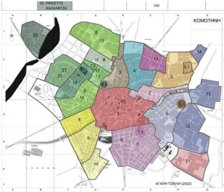
Εικόνα 1. Απόσπασμα χάρτη (ιδία επεξεργασία) με θέμα την παρουσία των εθνοπολιτισμικών ομάδων στις γειτονιές της Κομοτηνής. Στο απόσπασμα φαίνεται η θέση του Ηφαιστου (22) σε σχέση με τις υπόλοιπες γειτονιές της πόλης. Με μαύρο διακρίνεται ο χείμαρρος Βοσβόζης, ο οποίος αποτελεί το διαχωριστικό όριο ανάμεσα στον οικισμό και στον υπόλοιπο πολεοδομικό ιστό.

ντζα. Αν και εξαρχής η Καλκάντζα θεωρούνταν συνοικία της Κομοτηνής και όχι ένα ανεξάρτητο χωριό (Μαυρομάτης 2005: 102) ιδρύθηκε το 1938 μετά το χείμαρρο Βοσβόζη (Πος-Πος) που αποτελεί το φυσικό αλλά και συμβολικό διαχωριστικό όριο ανάμεσα στον οικισμό και στον υπόλοιπο πολεοδομικό ιστό (βλ. Εικόνα 1). Η Καλκάντζα ή Ηφαιστος κατοικείται από μουσουλμάνους και μουσουλμάνες οι οποίοι/ες στην εντόπια ταξινόμηση των διαφόρων εθνοτικών ομάδων που κατοικούν στην Κομοτηνή κατατάσσονται στη «χαμηλότερη» αξιολογικά κλίμακα από άποψη πολιτιστική, κοινωνική, οικονομική, ηθική, εθμική και σωματοτυπική και ανήκουν στα πιο αδύναμα και κοινωνικά περιφερειακά ή περιθωριοποιημένα στρώματα της μουσουλμανικής μειονότητας (Ιωαννίδου 2004: 5). Οι περισσότεροι κάτοικοι της Κομοτηνής χαρακτηρίζουν τους μουσουλμάνους κατοίκους του οικισμού ως μουσουλμάνους Αθίγγανους αδιαφορώντας για τον αυτοπροσδιορισμό τους, παρότι το σύνολο σχεδόν των κατοίκων του οικισμού δεν αποδέχεται τον προσδιορισμό του Τσιγγάνου. Εξαιτίας της μη αποδοχής της εθνοπολιτισμικής ταυτότητας που τους αποδίδει η υπόλοιπη κοινωνία, οι κάτοικοι του