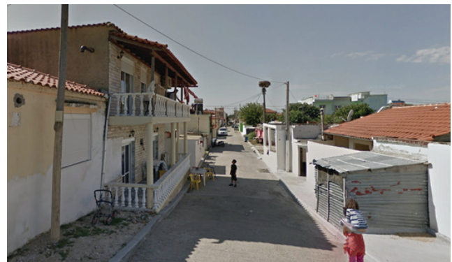
Εικόνες 2, 3, 4. Καθημερινή ζωή στην Καλκάντζα

βάνουν τη δημιουργία χορευτικού τμήματος και ποδοσφαιρικής ομάδας και προσλαμβάνεται χοροδιδάσκαλος για τη διδασκαλία ελληνικών παραδοσιακών χορών. Τα μέλη του συλλόγου παρελαύνουν στην παρέλαση της 28ης Οκτωβρίου 1994 φορώντας ελληνικές παραδοσιακές στολές. Η απάντηση έρχεται σε λιγότερο από ένα μήνα. Ιδρύεται στον Ήφαιστο δεύτερος πολιτιστικός σύλλογος με τον τίτλο Μορφωτικός Σύλλογος Ηφαιστου με άγνωστους χορηγούς. Πρώτο μέλημα του νέου συλλόγου είναι επίσης η ίδρυση χορευτικού τμήματος, η παραγγελία στολών από την Τουρκία (με επιχορήγηση της Νομαρχίας Ροδόπης ανάλογη με αυτήν που εισπράττει κάθε πολιτιστικός σύλλογος) και η πρόσληψη χοροδιδασκάλου για να διδάξει τουρκικούς παραδοσιακούς