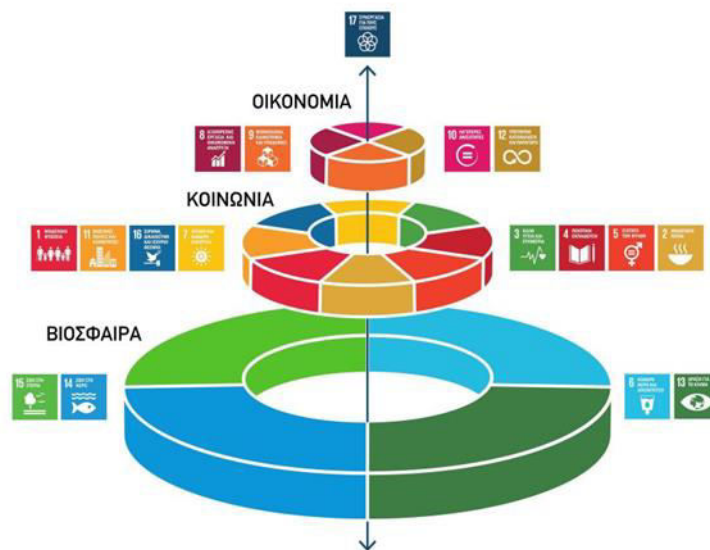
Εικόνα 1: Πυλώνες Βιώσιμης Ανάπτυξης.

δυνατού αποτελέσματος για τον πολίτη. Η βιωσιμότητα σαν έννοια έχει μια πολυεπίπεδη εξάρτηση από την κοινωνική πραγματικότητα, γεγονός που την καθιστά εξαιρετικά περίπλοκη ως προς την υλοποίησή της. Οι καθημερινές «απειλές» σε επίπεδο βιωσιμότητας είναι πολλαπλές. Αυτό καθιστά αναγκαία «τη συνδυασμένη συμμετοχή ενός ευρέως φάσματος ανθρωπίνων δικτύων, γνώσεων, αισθητήρων και καινοτόμων ιδεών» για την προσέγγιση οποιασδήποτε λύσης (Βλαχοκώστας κ.α., 2015: 84). Προβλήματα όπως η ατμοσφαιρική ρύπανση, η αλόγιστη κατανάλωση, η καταπάτηση των δικαιωμάτων, η ανισότητα (π.χ. Ρομά, μετανάστες), η αδιαφάνεια, η φτώχεια, χαίρουν μιας ολιστικής αντιμετώπισης από τις δημόσιες και τοπικές αρχές, δηλαδή από την κορυφή προς την βάση (top-down governance). Το ζήτημα όμως της βιώσιμης ανάπτυξης, ακριβώς λόγω της ιδιαίτερης και πολυεπίπεδης φύσεως του (Εικόνα 1), δεν δύναται να επιλυθεί δια αυστηρών επιβολών και νομικών ρυθμίσεων. Χρειάζεται μια συνολική αλλαγή νοοτροπίας και αξιακής θεώρησης στην κατεύθυνση μιας ανάπτυξης με όρους περιβαλλοντικής ευαισθησίας, διαγενεακής και ενδογενούς δικαιοσύνης, υπεύθυνης και ηθικής κατανάλωσης και όχι με όρους οικονομικής μεγέθυνσης, χωρίς ίχνος κοινωνικής και περιβαλλοντικής αντίληψης και παιδείας (Ζέρβας, 2012).