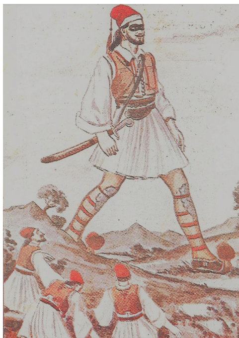
Couverture du roman populaire Καπετάν απέθαντος [ Le Capétan immortel ] (1949)

Publication initiale en fascicules par la maison d'édition Angkira