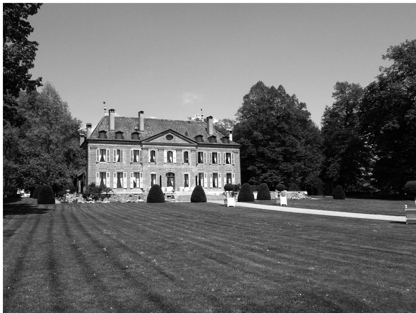
3. Château de Chouilly près de Genève.