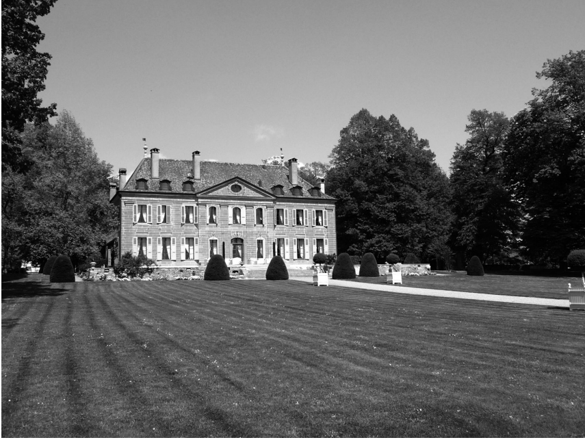
3. Château de Chouilly près de Genève.