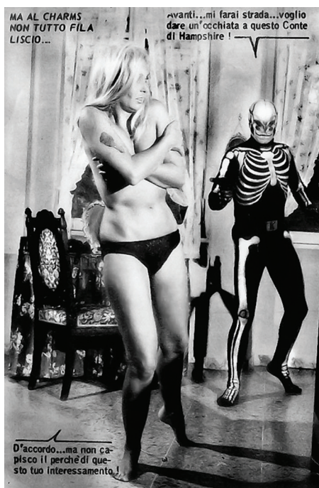
Extrait de Killing n° 17, « Baciami e uccidi », Milan, Ponzoni editore, 1967

Dans le même temps, l'Italie devient un lieu majeur de resémantisation du mythe, avec l'apparition de personnages dont les créateurs assument la parenté avec Fantômas. Ainsi, en 1962, naît Diabolik, « il re del terrore », distribué en bandes dessinées puis en romans par la maison d'édition milanaise Astorina. Ce personnage sert de modèle à la série de bande-dessinée Kriminal , qui met en scène « il re del delitto » (1964-1976), ainsi qu'au roman-photo Killing (1965-1969), édité aussi à Milan, et qui prendra ensuite le titre de Satanik . En dépit de différences structurelles importantes, comme les supports et le public visé, tous partagent des attributs typiquement « fantômassiens » : le visage masqué et le costume noir – agrémenté de dessins d'os humains pour Kriminal et Killing –, la cruauté, l'usage d'artifices, de masques et de déguisements. À la fin des années 1960, ils sont adaptés au grand écran et portent à une dizaine le nombre de films européens réalisés à l'époque autour d'une figure de super-criminel. L'exemple italien suscite des traductions, des reprises et des réinterprétations en Grèce – c'est le cas notamment de la bande dessinée Φαντόμ [ Le Fantôme ], qui met en scène un vengeur masqué en collant – et en Turquie, où la culture