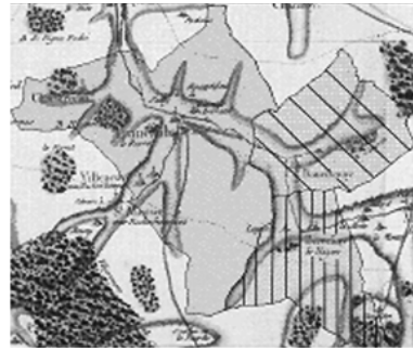
1832, 3 communes: Bercenay-le-Hayer, Bourdenay, Trancault

Cet exemple montre l'obstination des populations à refuser toute remise en cause de leur statut identitaire de commune. Ces communes ont connu, au long des deux siècles, des mouvements de fusion qui furent suivis, parfois de nombreuses années après, d'une reprise d'indépendance.