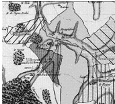
1801, 5 communes: Bercenay-le-Hayer, Bourdenay, Charmesseaux, Trancault, Villeneuve-aux-Riches-Hommes