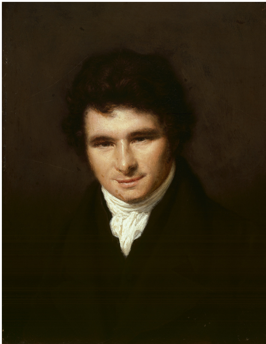
1. Portrait de Louis-André Gosse, par Jacques-Laurent Agasse, 1819. Collection privée.