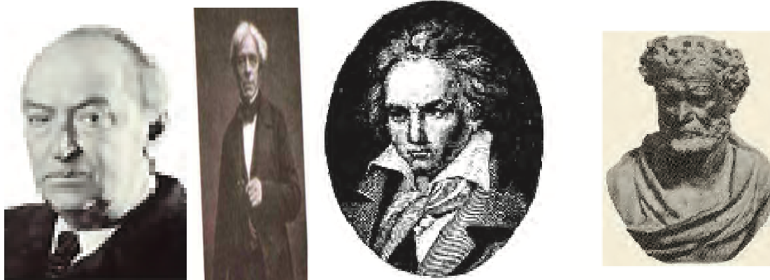
Εικόνα 8 Σικελιανός, Newton, Μπετοβεν, Μότσαρτ στα εγχειρίδια του «Ερευνώ και Ανακαλύπτω» και της Γεωγραφίας Ε΄ και Στ΄ Δημοτικού.

Μερικά από τα διάσημα πρόσωπα για τα οποία γίνεται λόγος στο μάθημα «Ερευνώ και Ανακαλύπτω» είναι: Δημόκριτος (ΦΕ: 14), Αναξίμανδρος ο Μιλήσιος (ΦΕ: 77), Α. Σικελιανός (ΦΕ: 84), Οδυσσέας (ΦΕ: 92), Μπετόβεν (ΦΕ: 100), Πύρρος Δήμας (ΦΕ: 108), Leonardo da Vinci (ΦΕ: 78), Ο Νάρκισσος (ΦΕ: 83), Newton (ΦΣΤ: 106), Braille (ΦΣΤ: 111), Christian Oersted (ΦΣΤ: 99).