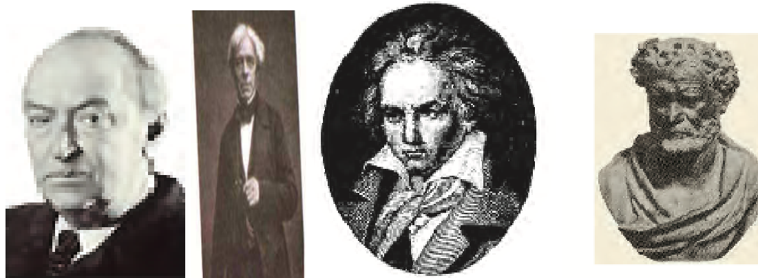
Εικόνα 8 Σικελιανός, Newton, Μπετοβεν, Μότσαρτ στα εγχειρίδια του «Ερευνώ και Ανακαλύπτω» και της Γεωγραφίας Ε΄ και Στ΄ Δημοτικού.

Μερικά από τα διάσημα πρόσωπα για τα οποία γίνεται λόγος στο μάθημα «Ερευνώ και Ανακαλύπτω» είναι: Δημόκριτος (ΦΕ: 14), Αναξίμανδρος ο Μιλήσιος (ΦΕ: 77), Α. Σικελιανός (ΦΕ: 84), Οδυσσέας (ΦΕ: 92), Μπετόβεν (ΦΕ: 100), Πύρρος Δήμας (ΦΕ: 108), Leonardo da Vinci (ΦΕ: 78), Ο Νάρκισσος (ΦΕ: 83), Newton (ΦΣΤ: 106), Braille (ΦΣΤ: 111), Christian Oersted (ΦΣΤ: 99).