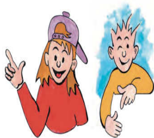
Εικόνα 2 Τα δύο παιδιά που βοηθούν στη διεκπεραίωση των δραστηριοτήτων του σχολικού εγχειριδίου «Ερευνώ και Ανακαλύπτω» της Ε΄ και Στ΄ τάξης Δημοτικού.

Εμφανές είναι ότι οι άντρες βρίσκονται στο επίκεντρο των εξελίξεων αναλαμβάνοντας ρόλους πρωταγωνιστικούς επισκιάζοντας τις γυναίκες, οι οποίες όταν εμφανίζονται, παραμένουν εγκλωβισμένες σε παραδοσιακούς, για το φύλο τους, ρόλους.