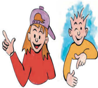
Εικόνα 2 Τα δύο παιδιά που βοηθούν στη διεκπεραίωση των δραστηριοτήτων του σχολικού εγχειριδίου «Ερευνώ και Ανακαλύπτω» της Ε΄ και Στ΄ τάξης Δημοτικού.

Εμφανές είναι ότι οι άντρες βρίσκονται στο επίκεντρο των εξελίξεων αναλαμβάνοντας ρόλους πρωταγωνιστικούς επισκιάζοντας τις γυναίκες, οι οποίες όταν εμφανίζονται, παραμένουν εγκλωβισμένες σε παραδοσιακούς, για το φύλο τους, ρόλους.