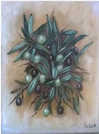
Αλεξανδρούπολη 2017, Τεύχος 6

ΕΡΕΥΝΑ ΣΤΗΝ ΕΚΠΑΙΔΕΥΣΗ HELLENIC JOURNAL OF RESEARCH IN EDUCATION