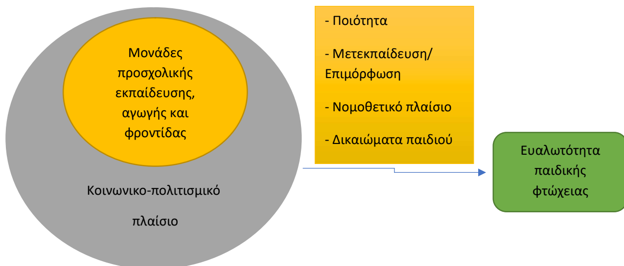
Σχήμα 2. Επιδραστικοί παράγοντες στην αντιμετώπιση της ευαλωτότητας στην παιδική φτώχεια

Απαιτείται μια συναντίληψη του τι χρειάζονται οι οικογένειες που πλήττονται από τη φτώχεια, καθώς και μια δεσμευτική διαρθρωτική και θεσμική αγκύρωση προκειμένου να καταστεί δυνατή και να διασφαλιστεί συντονισμένη δράση. Μια ομάδα εμπειρογνομόνων από την προηγμένη πρωτοβουλία κατάρτισης για επαγγελματίες προσχολικής ηλικίας (WiFF) στη Γερμανία προσδιόρισε τι χρειάζονται οι οικογένειες που πλήττονται από τη φτώχεια (DJI/WiFF 2014). Σύμφωνα με αυτούς, η πρόληψη της παιδικής φτώχειας αφορά την πορεία «από τη γέννηση έως την έναρξη μιας καριέρας», η οποία διασφαλίζεται και διαμορφώνεται στην αλληλεπίδραση πολλών ανθρώπων και ιδρυμάτων. Σε αυτήν την πορεία η στάση του επαγγελματία της πρώιμης παιδικής ηλικίας έχει καθοριστικό ρόλο όταν θεμελιώνεται στη διαφάνεια και εκτίμηση, στον σεβασμό, στην ενσυναίσθηση, στον προσανατολισμό στους διαθέσιμους πόρους και τις λύσεις, αλλά και στη θέληση για συνεργασία και δικτύωση με κοινωνικές υπηρεσίες και ιδρύματα. Η θεσμική ευαισθησία στη φτώχεια, οφείλει να αντικατοπτρίζεται στις ενέργειες των επαγγελματιών της προσχολικής εκπαίδευσης. Οι επαγγελματίες οφείλουν να έχουν βασικές γνώσεις για τη φτώχεια. Η φτώχεια εκλαμβάνεται ως κοινωνικό φαινόμενο και όχι ως ατομικό σφάλμα ή ακόμη και ως αποτυχία των γονέων. Η απόδοση ευθυνών οδηγεί σε αδιανόητη όξυνση των προκαταλήψεων χωρίς να ψάχνουμε λύσεις.