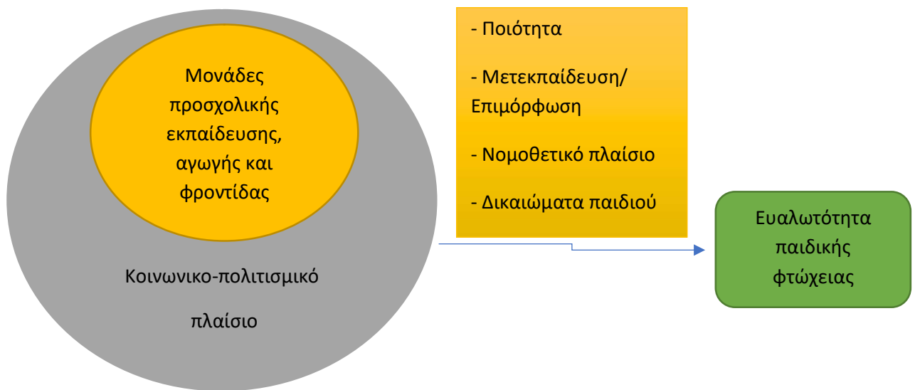
Σχήμα 2. Επιδραστικοί παράγοντες στην αντιμετώπιση της ευαλωτότητας στην παιδική φτώχεια

Απαιτείται μια συναντίληψη του τι χρειάζονται οι οικογένειες που πλήττονται από τη φτώχεια, καθώς και μια δεσμευτική διαρθρωτική και θεσμική αγκύρωση προκειμένου να καταστεί δυνατή και να διασφαλιστεί συντονισμένη δράση. Μια ομάδα εμπειρογνομόνων από την προηγμένη πρωτοβουλία κατάρτισης για επαγγελματίες προσχολικής ηλικίας (WiFF) στη Γερμανία προσδιόρισε τι χρειάζονται οι οικογένειες που πλήττονται από τη φτώχεια (DJI/WiFF 2014). Σύμφωνα με αυτούς, η πρόληψη της παιδικής φτώχειας αφορά την πορεία «από τη γέννηση έως την έναρξη μιας καριέρας», η οποία διασφαλίζεται και διαμορφώνεται στην αλληλεπίδραση πολλών ανθρώπων και ιδρυμάτων. Σε αυτήν την πορεία η στάση του επαγγελματία της πρώιμης παιδικής ηλικίας έχει καθοριστικό ρόλο όταν θεμελιώνεται στη διαφάνεια και εκτίμηση, στον σεβασμό, στην ενσυναίσθηση, στον προσανατολισμό στους διαθέσιμους πόρους και τις λύσεις, αλλά και στη θέληση για συνεργασία και δικτύωση με κοινωνικές υπηρεσίες και ιδρύματα. Η θεσμική ευαισθησία στη φτώχεια, οφείλει να αντικατοπτρίζεται στις ενέργειες των επαγγελματιών της προσχολικής εκπαίδευσης. Οι επαγγελματίες οφείλουν να έχουν βασικές γνώσεις για τη φτώχεια. Η φτώχεια εκλαμβάνεται ως κοινωνικό φαινόμενο και όχι ως ατομικό σφάλμα ή ακόμη και ως αποτυχία των γονέων. Η απόδοση ευθυνών οδηγεί σε αδιανόητη όξυνση των προκαταλήψεων χωρίς να ψάχνουμε λύσεις.