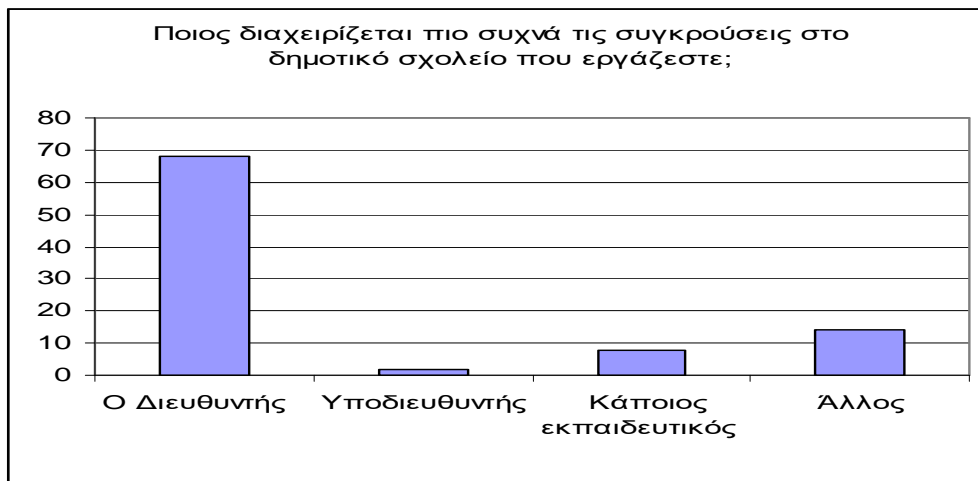
Σχήμα 2: Κατανομή διαχείρισης των συγκρούσεων στα δημοτικά σχολεία