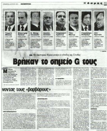
Εικόνα 2: Ελευθεροτυπία, 20/7/2001

θεντικότητα, ενώ ο εχθρός “δαιμονοποιείται” και αναπαρίσταται ως απειλητικός και μισοματικός».27 Με τον ίδιο τρόπο, το «πλήθος» το οποίο συγκροτείται ως θύμα και αενάως απειλούμενο, μέσω ενός οικουμενιστικού ουτοπισμού και ηθικισμού, ενσαρκώνει «τους ανθρώπους πάνω από τα κέρδη» και οι κινητοποιήσεις, στα πλαίσια μιας ιδεαλιστικής εξιδανίκευσης, αποκτούν το χαρακτήρα του εννοιολογικού και ηθικού επαναπροσδιορισμού των όρων ζωής των πολιτών κάτω από τις νέες συνθήκες της παγκοσμιοποίησης.