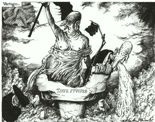
Martin Rowson, The Guardian , 2005.