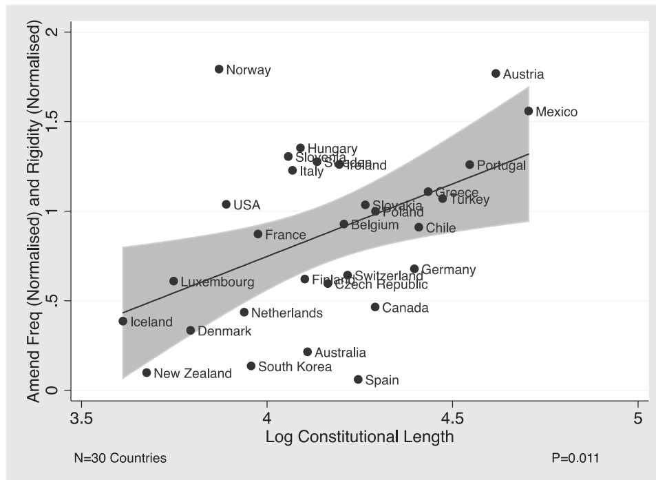
FIGURE 4. Constitutional rigidity and. number of amendment events in OECD vs. log constitutional length

for different constitutional lengths, since one compensates for the other. Yet, Figure 4 shows a different picture, one of a very strong and significant positive relationship between length and the combination of constitutional rigidity and amendment frequency. “