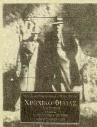
ΝΙΚΟΣ ΧΑΤΖΗΚΥΡΙΑΚΟΣ-ΓΚΙΚΑΣ ΧΡΟΝΙΚΟ ΦΙΛΙΑΣ ΜΕΤΑΦΡΑΣΗ ΑΝΔΡΕΑΣ ΜΑΡΤΙΝΙΔΗΣ