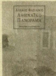
ΛΕΩΚΟΣ ΦΑΣΙΑΝΟΣ ΑΘΗΝΑΪΚΟ ΠΑΝΟΡΑΜΑ ΜΕΤΑΦΡΑΣΗ ΑΝΔΡΕΑΣ ΜΑΡΤΙΝΙΔΗΣ