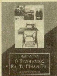
ΜΑΡῶ ΛΟΥΚΑ Ο ΠΕΖΟΓΡΑΦΟΣ ΚΑΙ ΤΟ ΠΙΘΑΡΙ ΤΟΥ ΜΕΤΑΦΡΑΣΗ ΑΝΔΡΕΑΣ ΜΑΡΤΙΝΙΔΗΣ