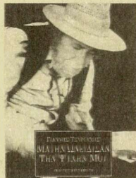
ΓΙΑΝΝΗΣ ΤΣΑΡΟΥΧΗΣ ΜΑΤΗΝ ΩΝΕΙΔΙΣΑΝ ΤΗΣ ΨΥΧΗΣ ΜΟΥ ΜΕΤΑΦΡΑΣΗ ΑΝΔΡΕΑΣ ΜΑΡΤΙΝΙΔΗΣ