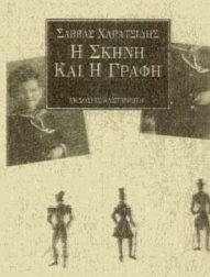
ΣΑΒΒΑΣ ΧΑΡΑΤΣΙΑΣ Η ΣΚΗΝΗ ΚΑΙ Η ΓΡΑΦΗ ΜΕΤΑΦΡΑΣΗ ΑΝΔΡΕΑΣ ΜΑΡΤΙΝΙΔΗΣ

ΝΙΚΟΣ ΧΑΤΖΗΚΥΡΙΑΚΟΣ-ΓΚΙΚΑΣ - ΧΕΝΡΥ ΜΙΛ ΛΕΡ: ΧΡΟΝΙΚΟ ΦΙΛΙΑΣ / ΜΑΡῶ ΛΟΥΚΑ: Ο ΠΕΖΟ ΓΡΑΦΟΣ ΚΑΙ ΤΟ ΠΙΘΑΡΙ ΤΟΥ / ΓΙΩΡΓΟΣ ΣΕΒΑ ΣΤΙΚΟΠΟΥΛΟΥ: ΠΡΑΞΙΣ / ΓΙΑΝΝΗΣ ΤΣΑΡΟΥΧΗΣ: ΜΑΤΗΝ ΩΝΕΙΔΙΣΑΝ ΤΗΝ ΨΥΧΗΝ ΜΟΥ / ΛΕΩ ΚΟΣ ΦΑΣΙΑΝΟΣ: ΑΘΗΝΑΪΚΟ ΠΑΝΟΡΑΜΑ / ΣΑΒ ΒΑΣ ΧΑΡΑΤΣΙΑΣ: Η ΣΚΗΝΗ ΚΑΙ Η ΓΡΑΦΗ