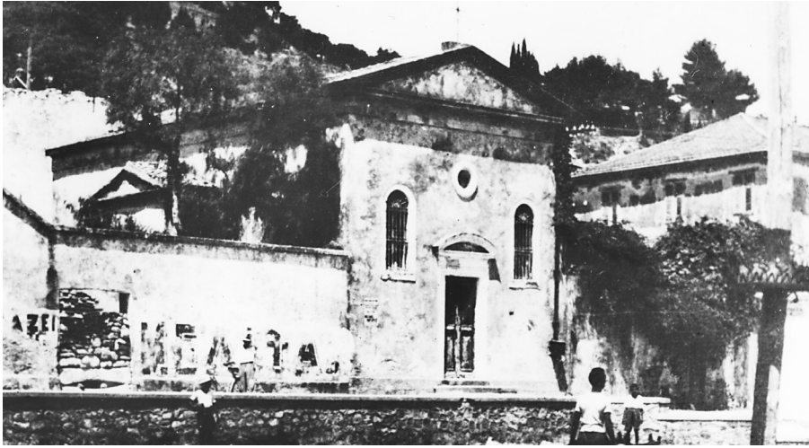
Εικόνα: Φωτογραφία της μονής της Santa Maria delle Grazie πριν από το 1953 (Αρχείο Σπ. Γαούτση)

Από τον κατάλογο 36 των προς δήμευση κτημάτων και των πλειοδοσιών που έγιναν για κάθε κτήμα, μπορούμε να δούμε την περιουσιακή κατάσταση της μονής. Το μοναστήρι κατείχε ικανή ακίνητη περιουσία σε πολλές περιοχές του νησιού. 37 συγκεκριμένα, στον κατάλογο αναφέρεται ένας ελαιώνας στο Νικολακάδο, 38 οκτώ ρίζες ελιές και αμπελώνας στην περιοχή Περάμπελα, 39 στα περίχωρα του χωριού Μαχαιράδο, το μετόχι Αυριακό 40