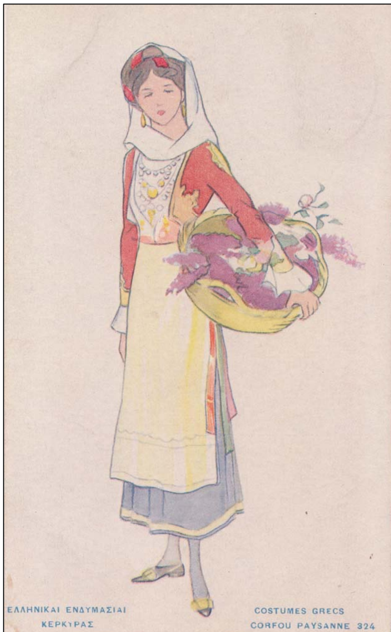
«Ελληνικαί ενδυμασίαι Κερκύρας / Costumes Grecs Corfou Paysanne». Χρωμοτυπολιθογραφείον Αδελφών Γ. Ασπιώτη – Κέρκυρα.