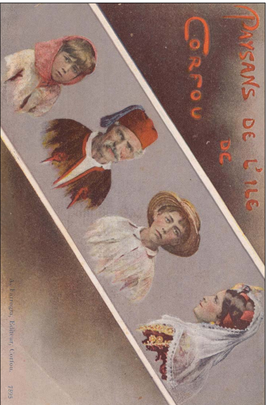
«Paysans de l'île de Corfou», A. Farrugia, Editeur, Corfou. Συλλογή Νίκου Α. Καράμπελα, Πρεβέζα.