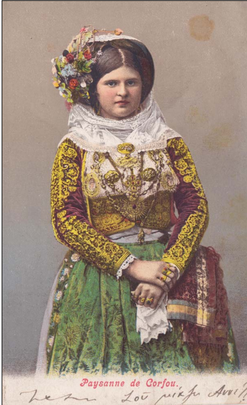
«Paysanne de Corfou». Συλλογή Νίκου Δ. Καράμπελα, Πρέβεζα.