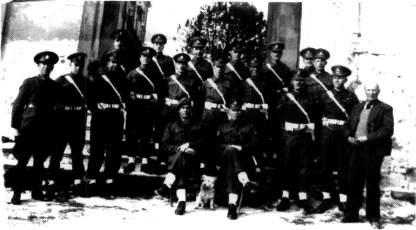
Η Βρετανική Στρατιωτική Αστυνομία μπροστά στη Δυτική Πύλη των Ανακτόρων των Αγίων Μιχαήλ & Γεωργίου (1945).