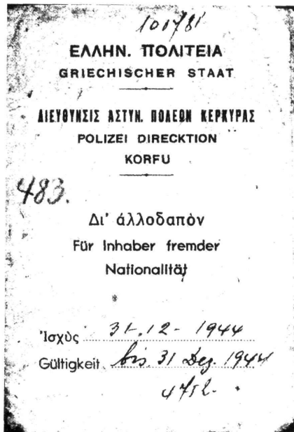
Εξώφυλλο ταυτότητας Βρετανίδας υπηκόου που εκδόθηκε στην Κέρκυρα επί Γερμανικής Κατοχής (1944).